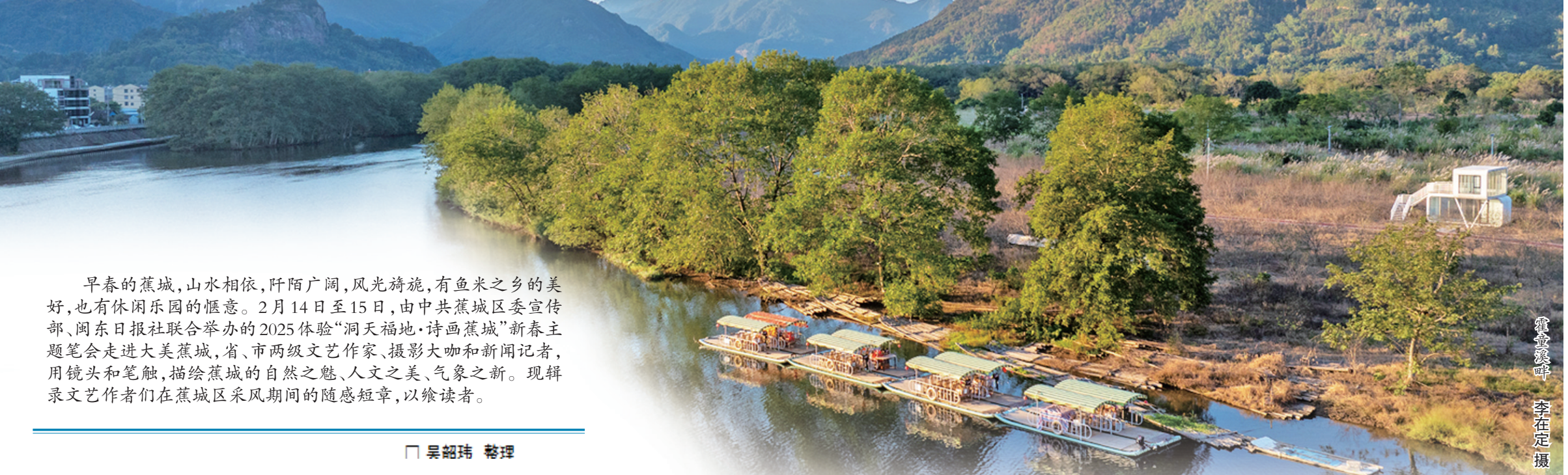
霍童溪畔

早春的蕉城,山水相依,阡陌广阔,风光旖旎,有鱼米之乡的美好,也有休闲乐园的惬意。2月14日至15日,由中共蕉城区委宣传部、闽东日报社联合举办的2025体验“洞天福地·诗画蕉城”新春主题笔会走进大美蕉城,省、市两级文艺家、摄影大咖和新闻记者,用镜头和笔触,描绘蕉城的自然之魅、人文之美、气象之新。现辑录文艺作者在蕉城区采风期间的随感短章,以飨读者。