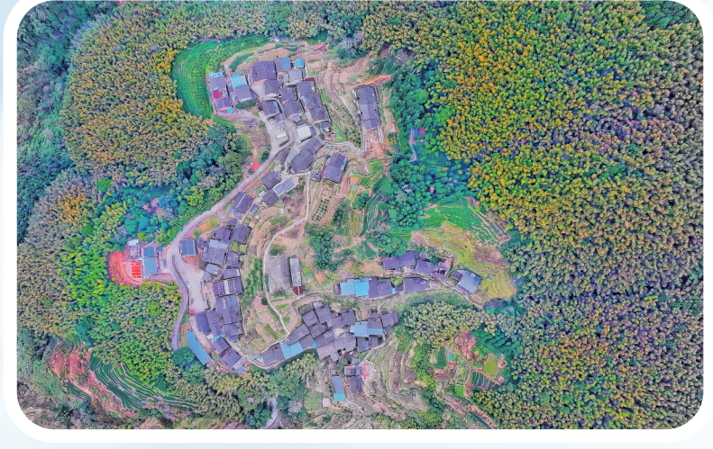
▲龙形村落——蕉城区洪口乡库山村