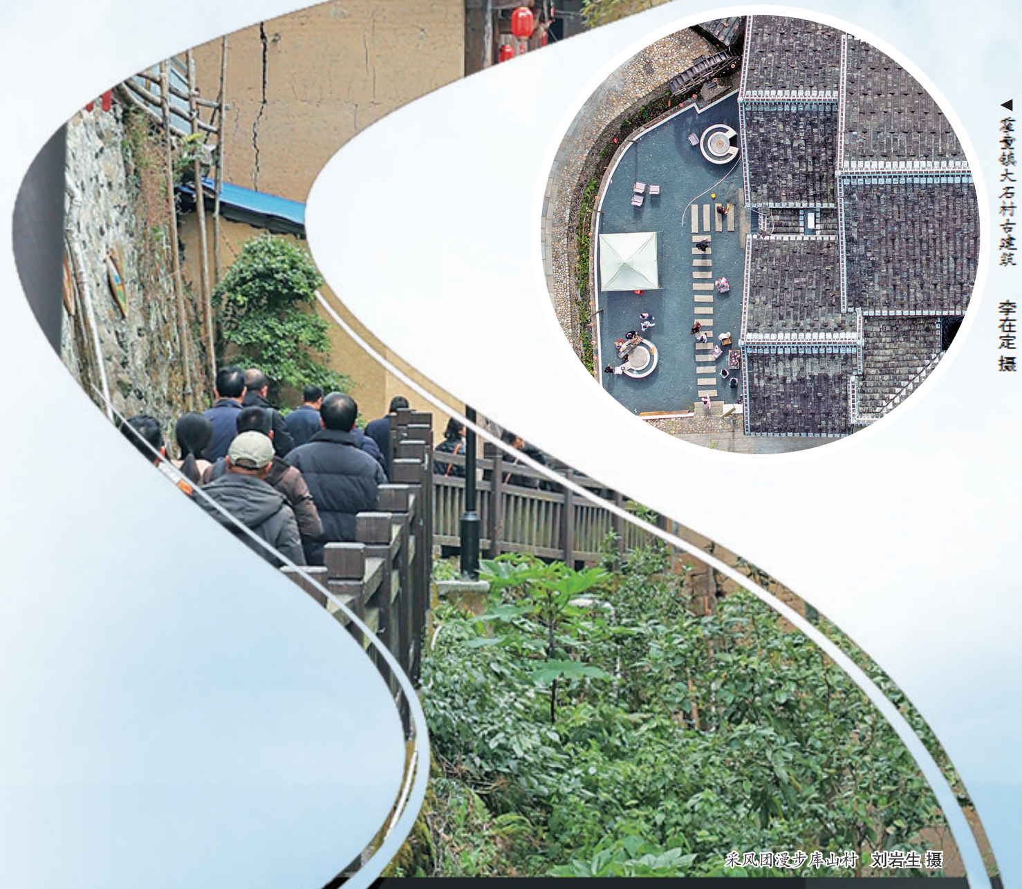
▲霍童镇大石村古民居