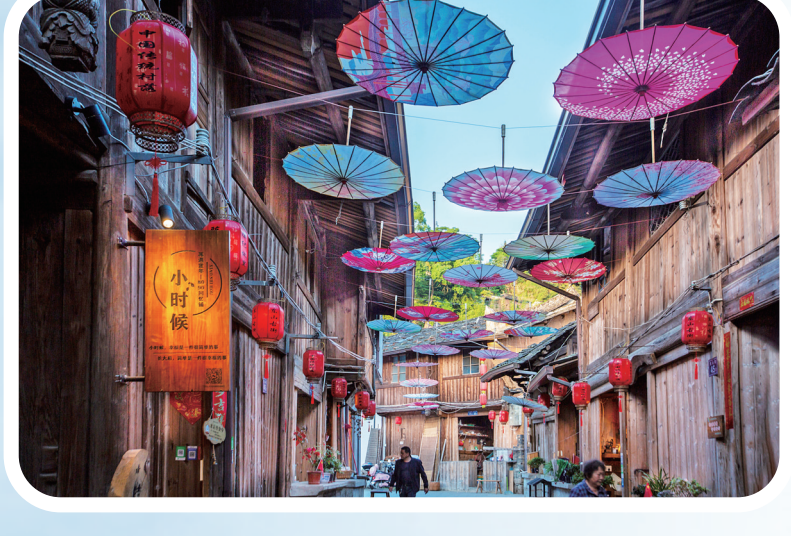
▲洋中镇文峰古街