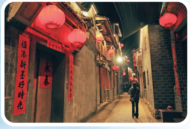
▲霍童古镇夜景