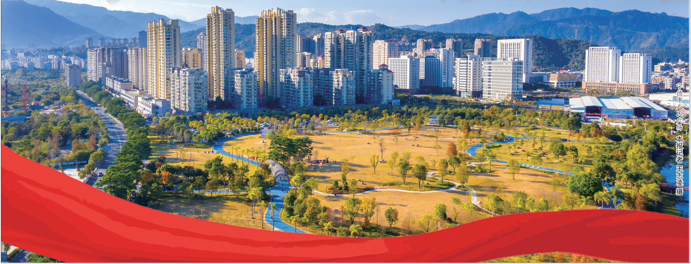
宁德市人民广场