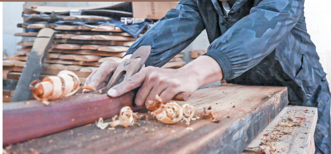
千凿万磨研制良琴