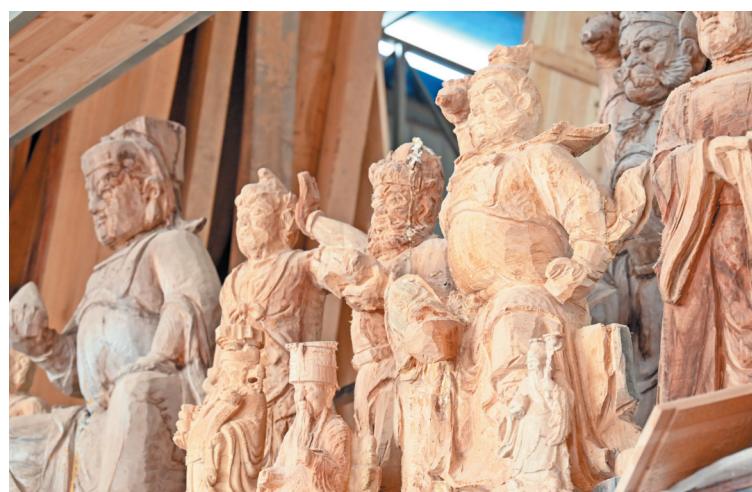
巧夺天工的木雕作品