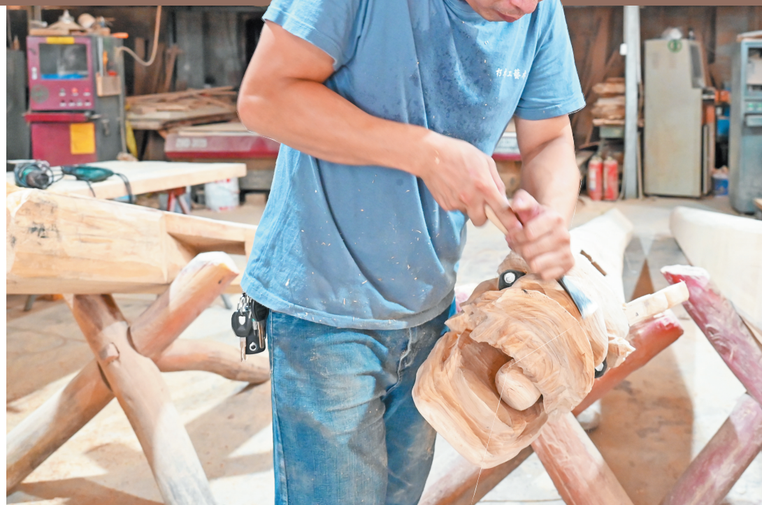
千刀万凿尽显“匠心”

继无人的窘境,作为非遗传承人,赖奶杨经常思考着这个问题,“我正在积极寻找对木雕技