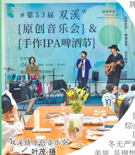
双溪镇原创音乐会

随着一个个文旅项目加速推进,屏南文旅发展不断迈上新台阶。2024年1月至6月,全县接待游客314.7万人次,同比增长16.1%,旅游综合收入27.06亿元,同比增长21.7%,呈现出文旅经济越做越旺的良好态势。