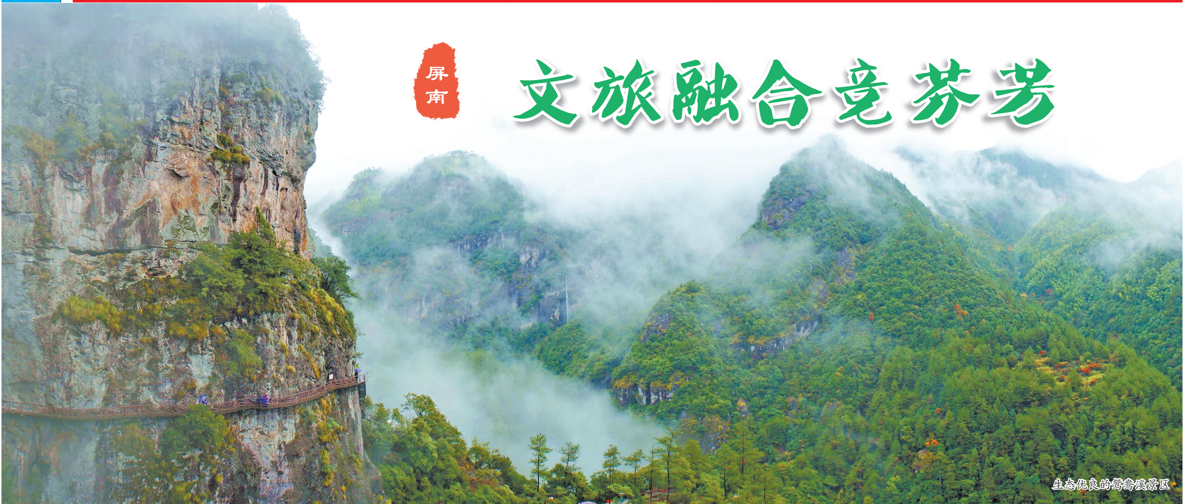
生态优良的鸳鸯溪景区