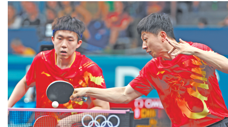
▲8月6日,中国队选手马龙(右)/王楚钦在比赛中。他们3比0战胜印度队选手德塞/塔卡。当日,在巴黎奥运会乒乓球男子16强赛的比赛中,中国队3比0战胜印度队,晋级八强。