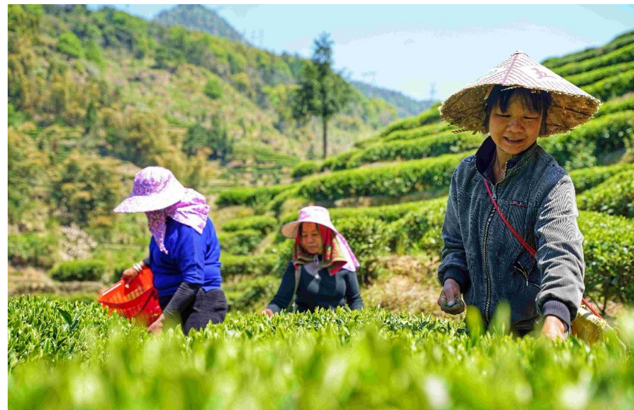
胜门村茶园里,茶农们忙着采摘春茶

三茶融合,进行茶树品种改良,推进茶叶初加工厂、清洁化工厂建设,筹备成立茶叶协会,鼓励茶企强化茶叶品牌与产品包装、茶文化挖掘和利用有