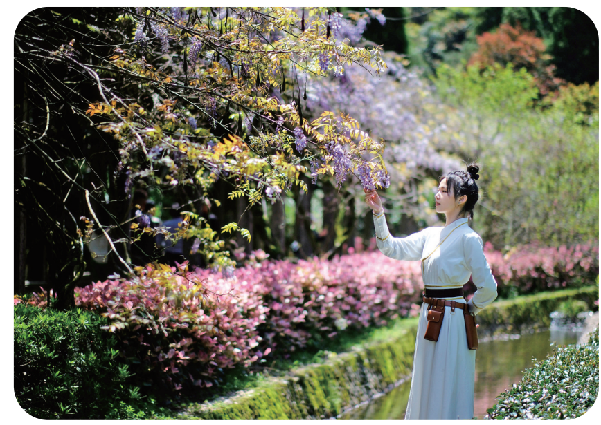
▲紫藤花开迎客来

提升和太姥山新月峰、七星洞、柳杉林节点改造等项目;同步开展赤溪经营性项目修复盘活及赤溪游客中心、畲家客栈后续验收等工作……去年“五一”“十一”假期,太姥山景区均荣登福建、宁德十大热门旅游景点前列。 “今年,我们进一步加快项目建设进度,加大宣传营销力度,优化旅游产品供给,全方位打造更具吸引力、更有知名度的旅游目的地,力争实现全年接待游客创新高。”白荣敏说。 依托资源优势,太姥山多渠道筹集建设资金,将持续实施一系列文化旅游基础设施和节点改造提升工程,并深化“旅游+”“+旅游”,创意策划夏季避暑夜游、秋季露营登高、冬季祈福朝拜等不同特色的四季主题活动,完成太姥山文创IP设计及衍生品开发、运用推广,大力引进高端品牌酒店,积极培育摄影写生、非遗演艺、研学修学等新兴业态,尝试打造休闲度假、体育赛事、医疗康养等产业集群,实现“旅游+体育”“旅游+白茶”“旅游+音乐”“旅游+文化”“旅游+康养”等融合发展。 □本报记者 朱灵媛 通讯员 王婷婷