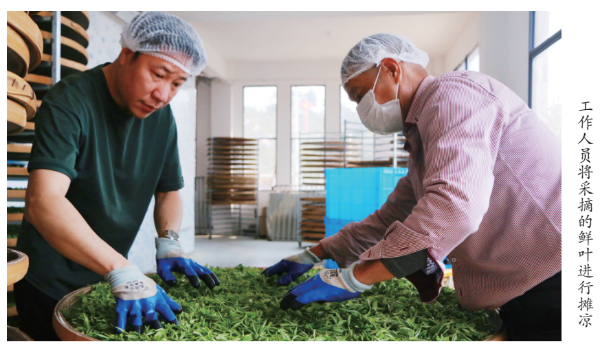
工作人员将采摘的鲜叶进行摊凉

4月2日,柘荣县英山乡石古兰村的石古兰生态野放茶茶园基地,千亩茶园迎来春茶采摘季。茶农们腰挎竹篓穿梭在茶树间,双手上下飞舞,娴熟地采摘着今年的第一茬嫩芽。