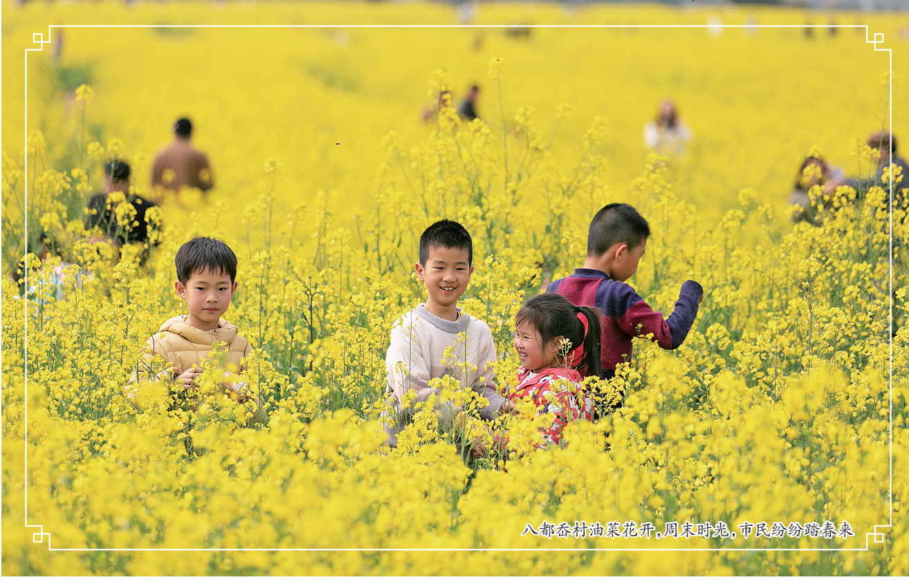
八都畚村油菜花开,周末时光,市民纷纷踏春来

三月春意浓,繁花次第开。当春日的雨露和阳光洒满大地,蕉城区迎来了最绚烂的季节。春风吹面不寒,霍童溪沿岸的十里桃花迎风绽放,赤溪镇的油菜花、桃花、李花争奇斗艳,八都畚村的油菜花盛开成一片“小婺源”,共同绘就了一幅幅生机盎然的春日画卷。 春来遍是桃花水,不辨仙源何处寻。春和景明的日子里,撑一支竹筏在霍童溪上任意西东,远望而去,桃花如粉云,氤氲自生香。桃花树下,游客或拍照留念,或静静欣赏,每个人的脸上都洋溢着春天的喜悦。远山如黛,曲水蜿蜒,长桥卧波,霍童的山明水秀增添了桃花的灵动。据清代《宁德县志》记载,霍童溪两岸曾广种桃花,每当春暖花开时节,呈现出“十里桃花夹岸”盛景。官至刑部尚书的林聪归游霍童时曾写下“洞天烟景路漫漫,万里归来试一看。夹岸桃花开正实,投林猿鸟自知闲”的诗句,从中也可略窥昔年霍童之美。如今,霍童溪畔共种下千亩桃树,同时,完善栈道、观赏亭、夜景灯光等配套设施,百余年前春风又吹到了霍童溪畔,百里画廊簪花色,人面桃花相映红。 而在十余公里开外的赤溪镇,这里的春天更是一幅五彩斑斓的画卷。桃花、李花、油菜花……一村一景,漫步在花海中,每一步都踏在春天的温柔与浪漫之上。 在赤溪黄田村,春风拂动,乡间泛起层层金色的“花浪”,空气中弥漫着清雅的油菜花香,花海与蓝天绿树、整洁村庄交相辉映,宛如一幅田园风景画,美不胜收。微风逐浪,花送暗香,踏春赏花的游人络绎不绝,古老的村庄因这勃发的生机而重焕活力。据了解,今年该村共计种植油菜花100多亩,近一个月都可观赏。 惊蛰大地万物生,皤皤李花挂枝头。位于赤溪镇大坛村内的60多亩李花也迎来了盛花期。错落有致的李树在和煦的春风中摇曳,洁白的李花在碧蓝的天空下尽情绽放,一簇簇、一团团,拥满枝头,千姿百态,呈现出一幅“李花怒放一树白,遥望疑是春飞雪”的花景。走近李花林,一股淡淡的花香扑鼻而来,清香淡雅,香而不浓,小蜜蜂也抢抓“农时”在花丛中飞舞采蜜,忙着属于自己的“春耕”。 赤溪镇社洋村,在春风的轻抚下,进入了一场桃花灼灼的视觉盛宴。阳光透过树梢,洒在娇嫩的花瓣上,使得每一朵