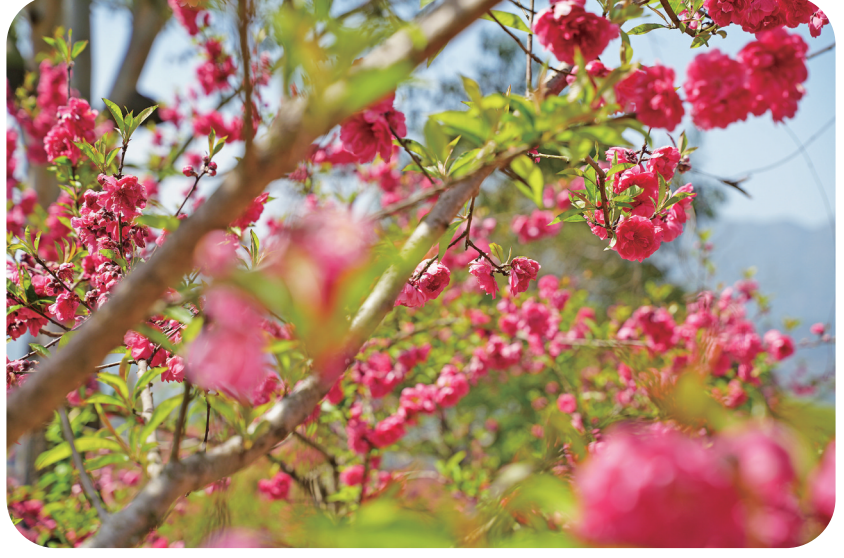
▲霍童溪畔,重现桃花夹岸盛景

桃花都显得格外娇艳动人。走在村间的小路上,空气中弥漫着淡淡的花香,一垄垄高低错落的桃花吸引着飞舞的野山蜂,近处花红柳绿,蜂逐蝶舞,远处公路蜿蜒,青山巍巍。古老的房屋、青石板路,以及悠闲自在的村民,都仿佛与这桃花融为一体,这一刻,这里便是陶渊明笔下的桃花源。 在八都畚村,这里300多亩的油菜花田可以用开得如火如荼来形容,在三月初的花事中,它成为当之无愧的流量之王。金黄的花海与远处的青山相映成趣,与近处的村庄毗邻而居。陌上花开蝴蝶飞,春天不辜负每一个生灵,花儿热闹地开着,人们熙熙攘攘地看着,花海里“长”出一张张绝不相同的笑脸,尽情享受春天的美好。 三月和风拂仲春,正是蕉城好风景,传语风光共流转,趁时相赏莫相违。 □ 郑霄 褚子强 文/图