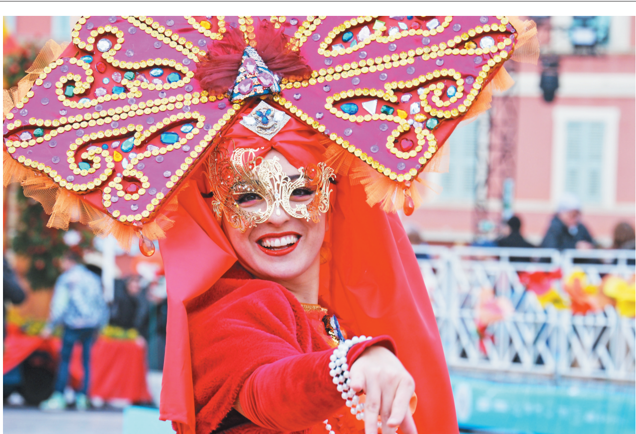
3月2日,演员在法国尼斯狂欢节上表演。2024年尼斯狂欢节于2月17日至3月3日举行。法国尼斯狂欢节是世界著名狂欢节之一,每年2月至3月间举行。

研究人员使用多种ZCCHC3蛋白的变异体进行实验,发现这种蛋白通过与病毒的Gag蛋白以及基因组RNA两者相结合抑制病毒增殖,降低病毒感染。研究人员表示,将研究利用这种蛋白的抗病毒功能研发新的艾滋病病毒控制方法。