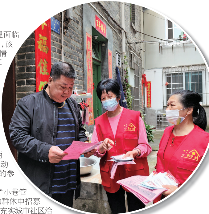
▲古田县城东街道文兴社区“小巷管家”向群众宣传消防安全知识

目前,古田县已建立“小巷管家”人才信息库,从不同的群体中招募“小巷管家”200多名,有效充实城市社区治理力量。