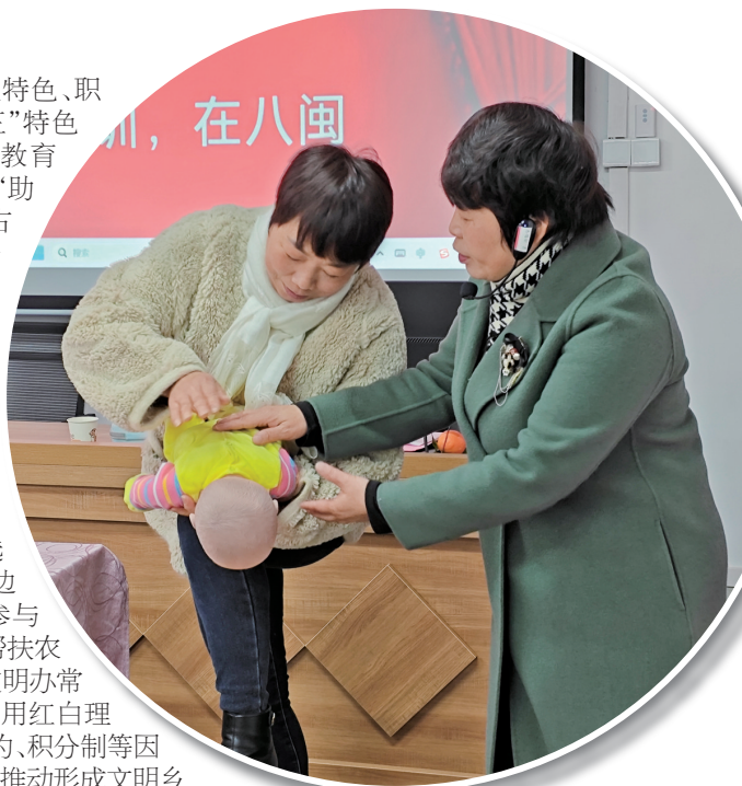
▲古田县举办顶梁柱母亲技能培训活动,帮助家庭困难的母亲学到一技之长

文明是城市最美的风景。当越来越多的人将崇善向上的“种子”埋进土壤,“文明之花”自然处处盛开。