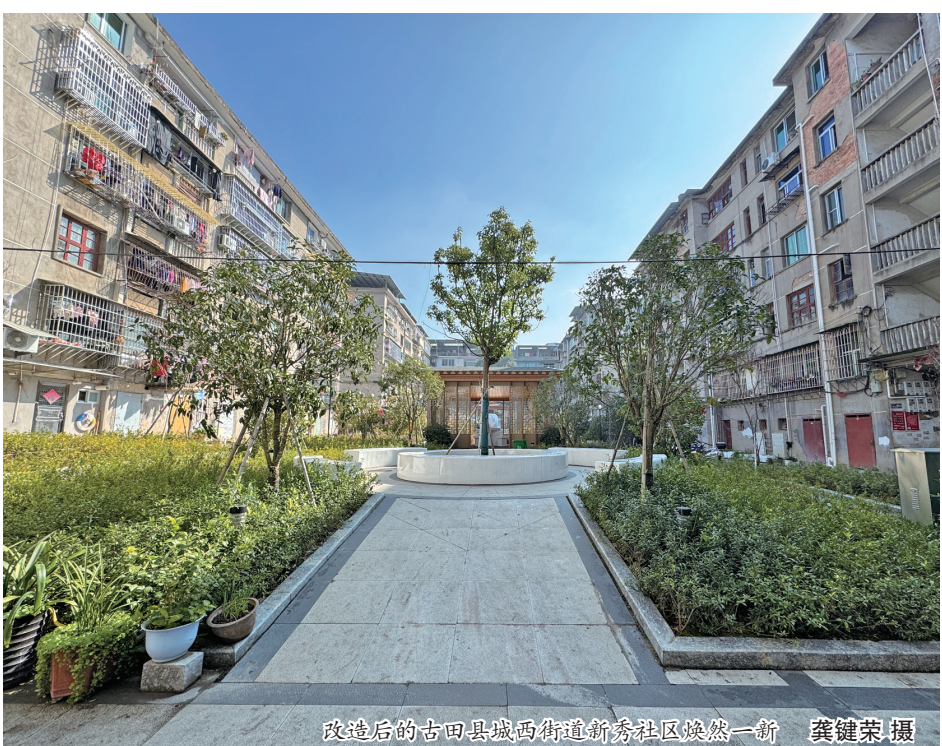
改造后的古田县城西街道新秀社区焕然一新

文明城市创建是一场永不停步的幸福接力。古田县委宣传部相关负责人表示,在实现连续四届获评省级文明县城后,全县上下将持续创新文明城市创建之道,把人民群众的“点赞量”作为检验文明城市创建的“含金量”,让全民共享整洁有序、安全舒适的城区环境,共创文明和谐、安定有序的社会环境。