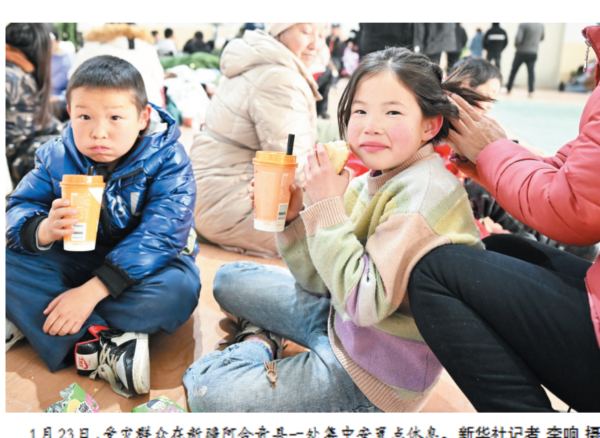
1月23日,受灾群众在新疆阿合奇县一处集中安置点休息。

地震突如其来,救援迅速有序。国务院抗震救灾指挥部办公室、应急管理部启动地震三级应急响应,并派出工作组赶赴震区指导抗震救灾工作。新疆消防救援总队41车、192人、3头搜救犬已