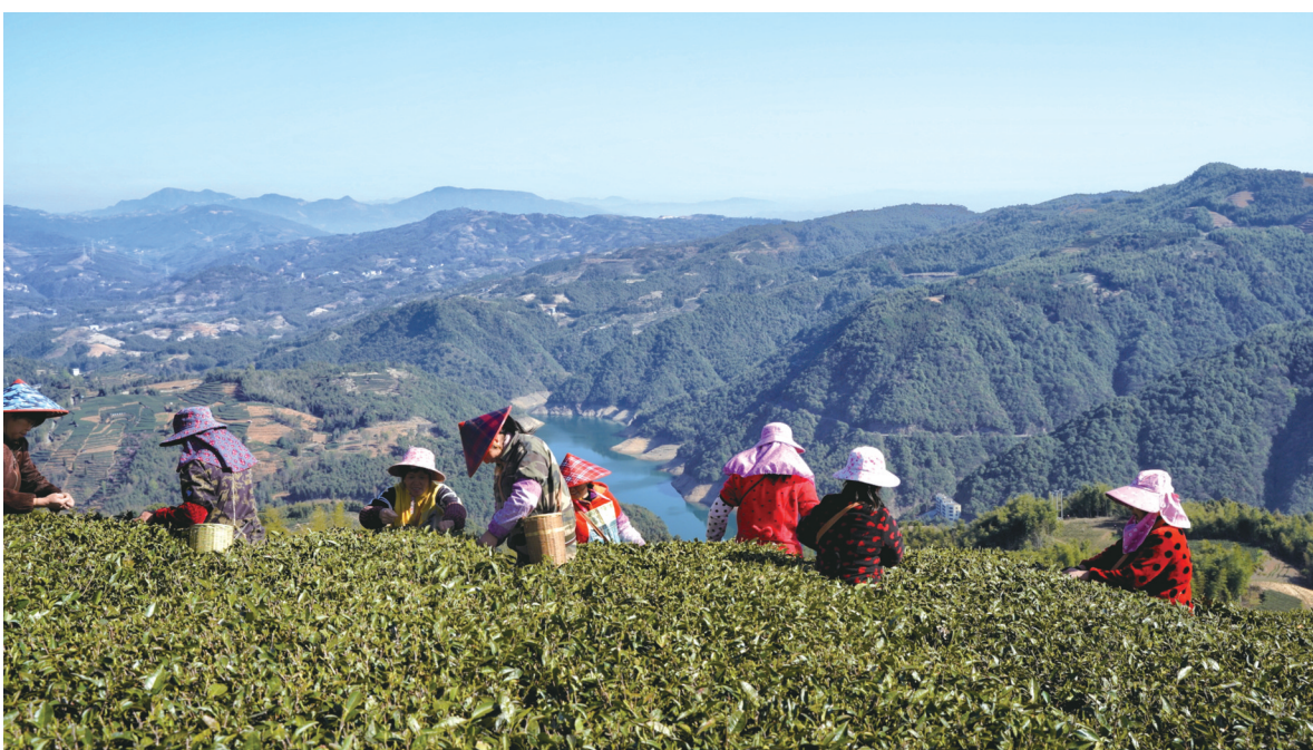
“一叶九鼎”茶园基地

“从叶片的检测数值上看,叶张中的钾、镁元素也有些缺乏,在冷空气过后,还需要补充一些。”