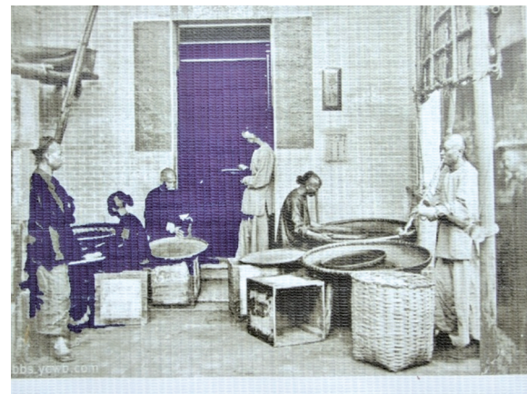
▼清末斜滩周丰记行

嘈杂声连成一片商贸繁荣的交响曲;加上夜里的松明、竹篾火把、风不动、煤油灯,把整个斜滩码头、街道、溪岸照得彻夜通明;船只马灯闪烁,在溪面上似密密麻麻的萤火闪烁,夜景十分壮观。据史料记载,鼎盛时期,斜滩开办经销茶叶的茶行24家,就有3000多人日夜加工精制茶叶和从事购销活动,生意兴隆,四通八达。这正印证了当年寿宁县令宋际春《咏斜滩》的五言诗所描述斜滩古镇的繁华景象。诗云:“岭势从天下,滩流委地斜。风烟团一市,茶香绕千家。夜剧村逢偶,春寒县闭衙。渔灯今夕见,百里最繁华。”