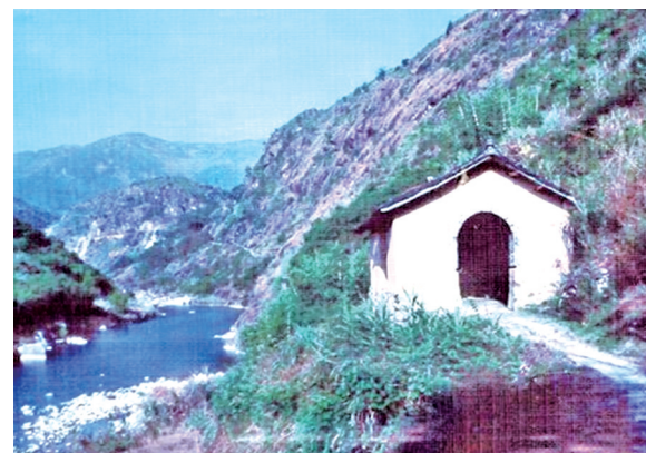
▲通往车岭古道的龙凤亭

那时候,每到茶叶上市季节,斜滩码头一年之中呈现一派繁忙景象。来自三村五境的茶农肩挑背扛新茶到斜滩收购;闽浙五县的茶商、挑茶工从四面八方云集斜滩溪岸两边埠头;周边山路上挑茶袋的、抬茶箱的络绎不绝,不分昼夜,风雨无阻;溪面上数百条“斜滩槽”往返穿梭,装茶上船的、卸货搬运的,熙熙攘攘,人流如过江之鲫。斜滩方圆数百米内,挑工杖杖敲地声、船夫起运呼喊声、商家村妇叫卖声、客棧老板招呼住宿声,此起彼伏,各种