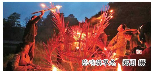
陈峭稻草龙

距离龙年春节不到一个月时间,在中华优秀传统文化中,“龙”寓意着风调雨顺、五谷丰登、太平安康,是中华民族与文明的重要象征。在周宁,龙元素可不少。从历史地名典故到传统非遗文化,处处与“龙”有着密切联系。