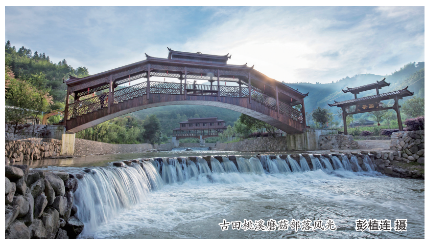
古田桃溪蘑菇部落风光 彭植连摄

以美食为媒,让味蕾绽放,让舌尖品味。来宁德,一起大饱口福! D1: 古田县蘑菇部落生态旅游区—大桥镇—屏南县北墩村—四坪村—龙潭里村 午餐大桥镇(菌菇宴),晚餐龙潭村(药膳、米烧兔等),晚上夜游龙潭里村,夜宿龙潭里民宿。 D2: 蕉城区霍童古镇景区—福安市穆云畲族乡生态旅游区—柘荣县 午餐霍童古镇(黄鱼宴),晚餐柘荣牛肉丸、太子参炖罐。夜宿柘荣县。 D3: 福鼎市美食街(桐山溪西小吃美食街或山前美食街或石湖美食街)—霞浦县(海鲜大排档一条街) 午餐福鼎美食街特色小吃,晚餐霞浦海鲜,夜宿霞浦。