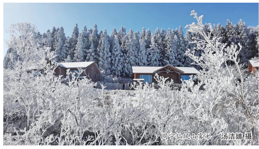
周宁仙风山雾凇

自在体验当地的民俗风情、传统技艺,炙热烟火,欢庆新春。 D1: 霞浦县溪南镇半月里村—蕉城区霍童古镇景区(霍童线狮) 午餐霞浦城关海鲜一条街,晚餐蕉城区霍童古镇,夜宿霍童古镇民宿。 D2: 福安市穆阳古镇(赶墟、烧火塔、猜灯谜等)—周宁县鲤鱼溪景区(板凳龙) 午餐福安市穆阳镇,晚餐周宁县,夜宿周宁县。 D3: 屏南县双溪古镇(香火龙)—古田县临水宫(临水文化) 午餐屏南县双溪镇,晚餐古田县,夜宿古田县。