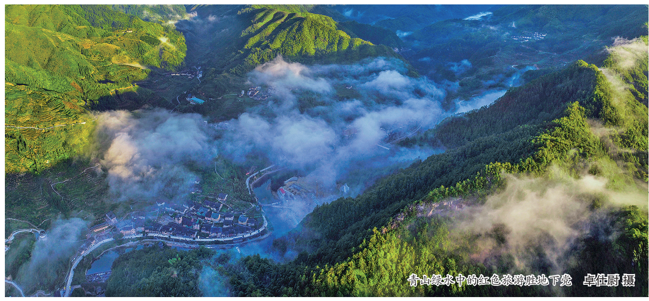
青山绿水中的红色旅游胜地

2024年春节即将来临,为了更好地满足广大市民和游客的旅游休闲需求,保障旅游产品供给,丰富假日旅游活动,我市串联山海风光、民俗文化、古镇名村、美食特产等特色资源,推出龙盘仙山踏雪之旅、龙行福地沐阳之旅、龙绘盛宴美食之旅、龙翔茶山品茗之旅“五龙迎春精品旅游线路”共5条,奉上丰富多彩的文旅大餐,让广大市民和游客在浓浓年味中,领略独特的闽东风情。