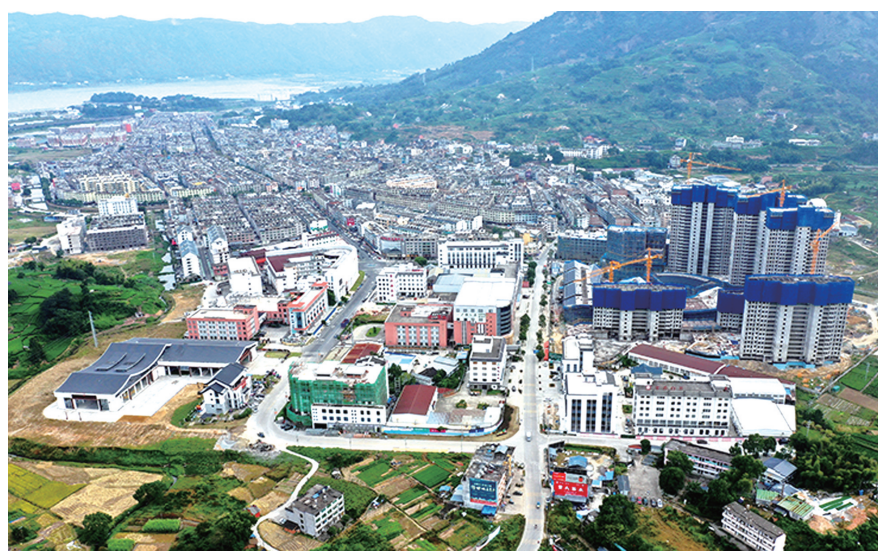
白茶小镇项目(右侧)

点头镇的柏柳、大坪、举州等7个村落散落在峰峦叠嶂、山峰耸立的山谷里,这里培育了“福鼎大白茶”“福鼎大毫茶”两个优良白茶品种,便有“白茶谷”之称。历史上,“白茶谷”各村落串连成一条通往外界的古驿道,也是一条古茶道。