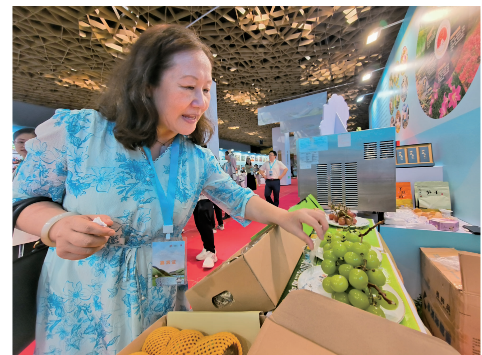
在北京鸟巢展会,周宁土特产受到消费者青睐

“周宁有鲤”品牌创立后,该县进一步加强线上线下营销渠道建设,与乡镇特色产业、企业品牌齐头并进,助推县域农业产业链条搭建。通过统一品牌、统一包装、统一品控、统一服务,带动全县加工企业在全国终端销售商产销精准对接,从种植端、加工端、销售端入手,提升整条供应链的产品供给、品控和服务水平。