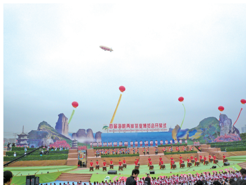
2007年,在福建省首届海峡两岸茶博会上,一架标有“福鼎白茶”字样的飞艇凌空而上。