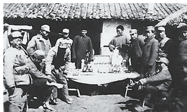
▲新四军“江抗”阳澄湖后方医院(资料图片)