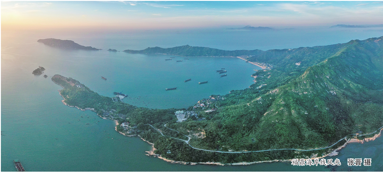
福鼎海岸线风光