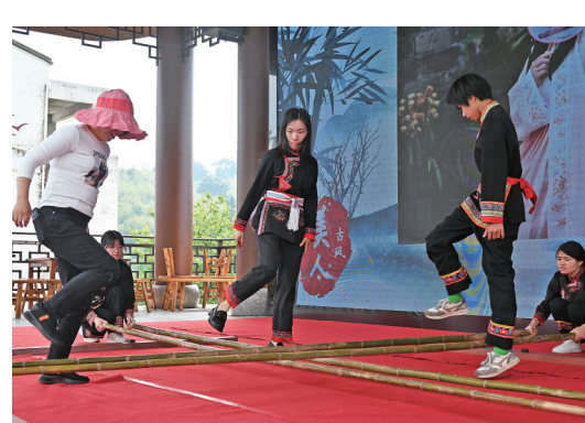
▲游客体验上金贝畲族特色游玩项目

俯瞰福鼎市海岸线, 激城堡、石兰堡、官城堡、黄岐堡等城堡仿若珍珠洒落。将这些古堡串联起来, 就形成了一条长长的堡链, 这种当年用于海防的滨海壁垒遗存, 被当地人称为“海上长城”。 坐拥432公里绵长海岸线的福鼎, 位于福建省东北部, 地理位置极为特殊, 既是陆地的省际交界之域, 也是山和海相遇的地方。数百年来, 以山为邻, 以海为界, 福鼎共修建31座城堡, 它们是地方海洋文化的历史见证, 其价值之重要、特色之丰富不可不察。