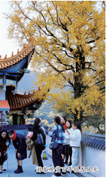
游客观赏百年银杏风光

叶仿佛给红墙黄瓦的寺庙披上了“金装”。午后, 阳光透过银杏叶, 洒在寺庙的各个角落, 使得整个寺庙都充满了温暖、祥和的气息。每当暖风吹过, 银杏叶随风飘落, 扬起一阵金色花雨, 如诗如画。 许多游客慕名而来, 他们走在寺庙的庭院中, 欣赏着满眼的金黄, 聆听着风吹过树叶的沙沙声, 享受着这份宁静而浪漫的冬日盛景。每一个角落, 每一片银杏叶, 都成了相机下的焦点, 定格了这份美丽的秋色。 □ 本报记者 郑霄 文/图