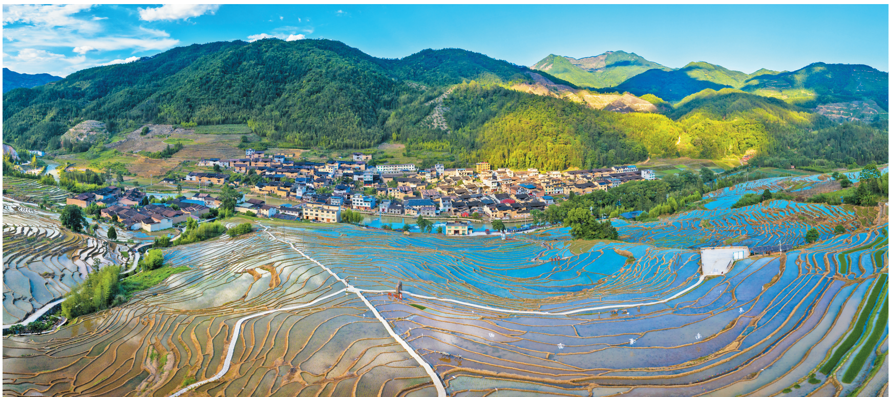
▲“一亩田”活动赋能,屏南柏源村形成千亩梯田,蔚为壮观。因为春耕时节,灌水后梯田倒映着蓝天白云,风景宜人,各地游客、摄影爱好者纷至沓来