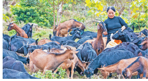
▲福鼎柘山镇,依托养殖专业合作社,推出“认领一只羊”发展模式