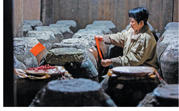
▲屏南北巘村,依托传统黄酒产业,开展“认领一坛酒”活动