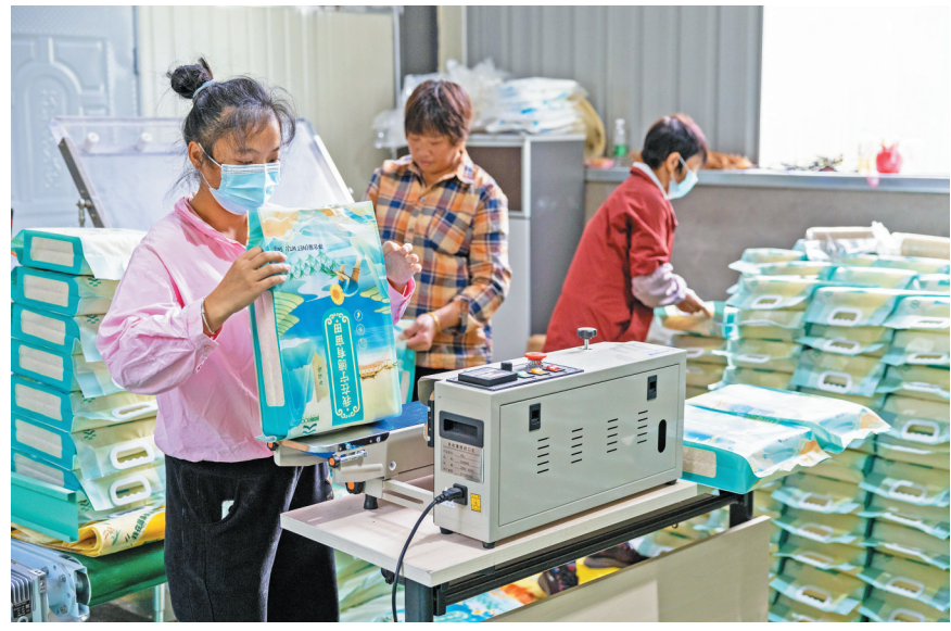
▲屏南县前汾溪村,村民在加工、包装新米,随后将配送到各认领者手中