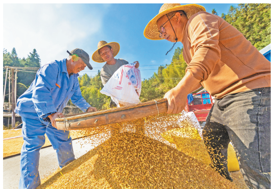
▲屏南棠口镇白溪门片区,合作社社员们在筛稻谷

稻香盈满仓,粮食加工忙。时下,屏南已完成水稻秋收工作,但分布在各乡村的烘干厂、加工厂却忙碌了起来。