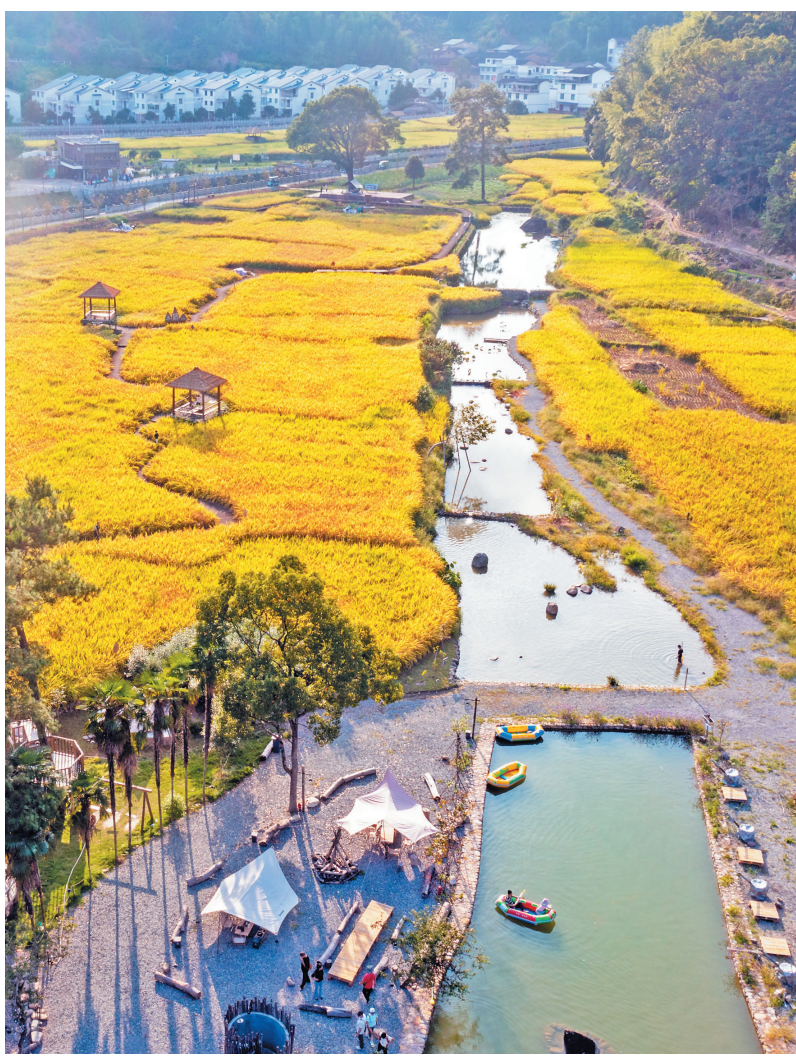
▲屏南白玉村,连片平坦的稻田成为观光休闲景点,还建起稻香营地,农旅融合发展,成为稻田摄影、研学、团建等项目的热门之地