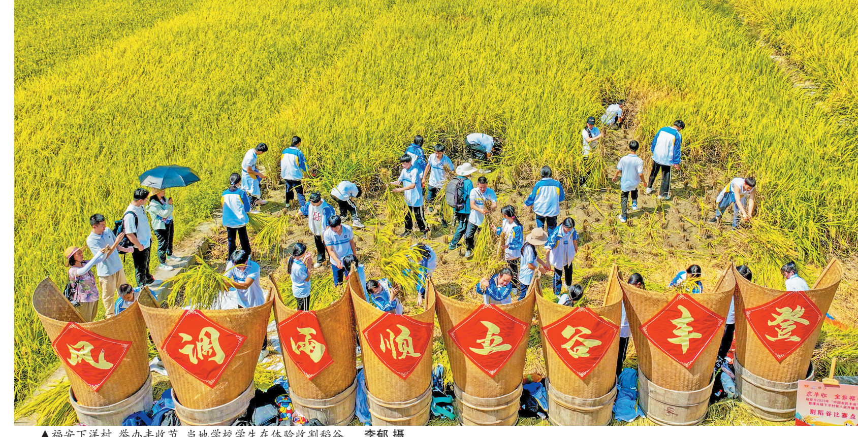
▲福安下洋村,举办丰收节,当地学校学生在体验收割稻谷