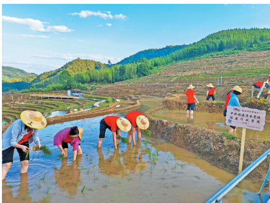
▲春耕时节,在屏南柏源村,认领单位在认领的田地里体验插秧