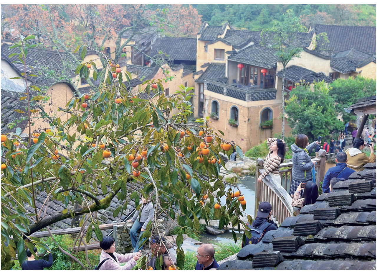
周宁:“特聘指导员”助力乡村“加速跑”

近年来,四坪村以打造特色旅游村庄为目标,推行“党委政府+村两委+艺术家+农民+古村+互联网”的文创建设发展模式,着力引进新业态,发展新产业,累计引进新村民46人,发展休闲农业和乡村旅游经营单位22家,年接待游客约30万人次。2022年,人均可支配收入达2.3万元,形成“人来、村活、业兴、文盛”的发展新格局。