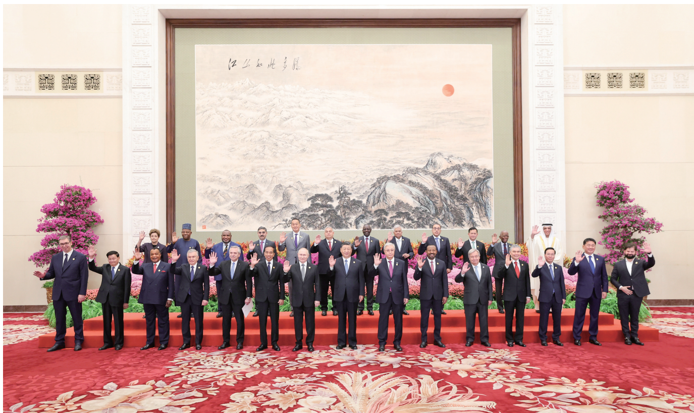
10月18日上午，国家主席习近平在北京人民大会堂出席第三届“一带一路”国际合作高峰论坛开幕式并发表题为《建设开放包容、互联互通、共同发展的世界》的主旨演讲。