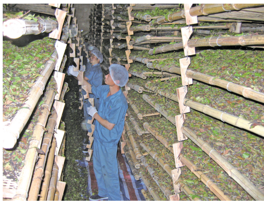
店下茶叶加工

巽城处沙埕港中段,依山傍海,为种植、贩卖茶叶提供了前提条件。巽城茶人北上苏州、南下福州等地苦心经营茶叶,为当地茶业发展奠定了坚实基础。同时也涌现出“施仁泰”“林长盛”以及林嗣元、林大钰等一批茶人茶商。经过梳理得知,清代,巽城的财主多达19户,其中有一大半是以经营茶叶为生或依靠茶叶发