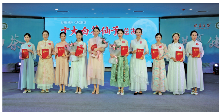
▲二〇二三年“白茶仙子”全国评选活动启动仪式