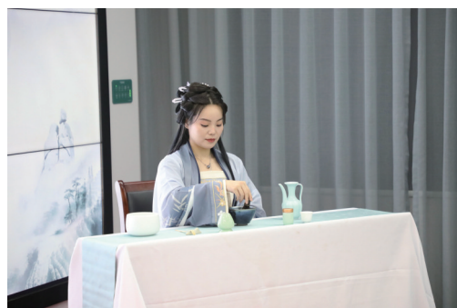
►往届“白茶仙子”在实验小学向学生推广白茶文化

为茶行业创造出更多元化的价值,还创立了自己的白茶品牌,担任了白茶故里·方家山的形象大使等,努力向大众推广福鼎白茶。