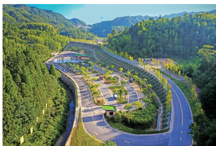
大安乡“四好农村路”

公路建设实施方案》，确定了农村公路三年行动两年完成总体目标。制定了补助政策：县道三级公路升级项目每公里补助300万元，县、乡道四级公路(双车道)升级项目每公里补助200万元，村道四级公路(单车道)新改建项目每公里补助60万元，少数民族和老区基点建制村乡道升级项目每公里追加6万元。同时，全面推行农村公路“路长