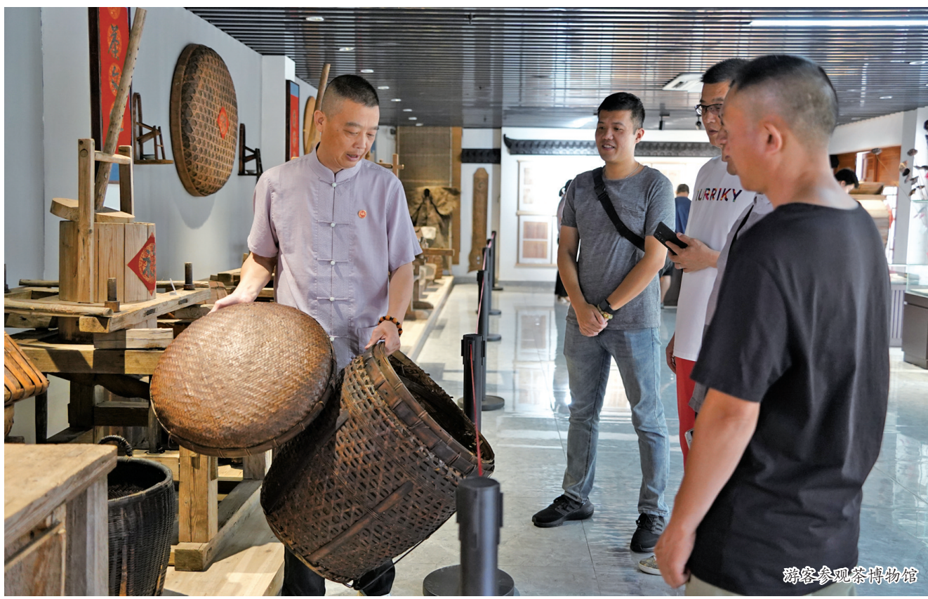
游客参观茶博物馆

值得一提的是,白云山茶博物馆开馆也是2023年非遗文化周的预热活动之一。坦洋工夫茶制作技艺传承至今已有一百七十多年的历史,清咸丰年间,坦洋村茶人以“坦洋菜茶”为原料,创制成功“坦洋工夫”红茶。坦洋工夫茶的出口兴盛,从清光绪六年到民国25年,平均每年出口的坦洋工夫茶多达10000多担,极大地促进了坦洋的市井繁荣。该茶经广州远销至西欧,受到广泛喜爱,更成为当时欧洲皇室贵族所青睐的下午茶。2021年,红茶制作技艺(坦洋工夫茶制作技艺)列入第五批国家级非物质文化遗产代表性项目