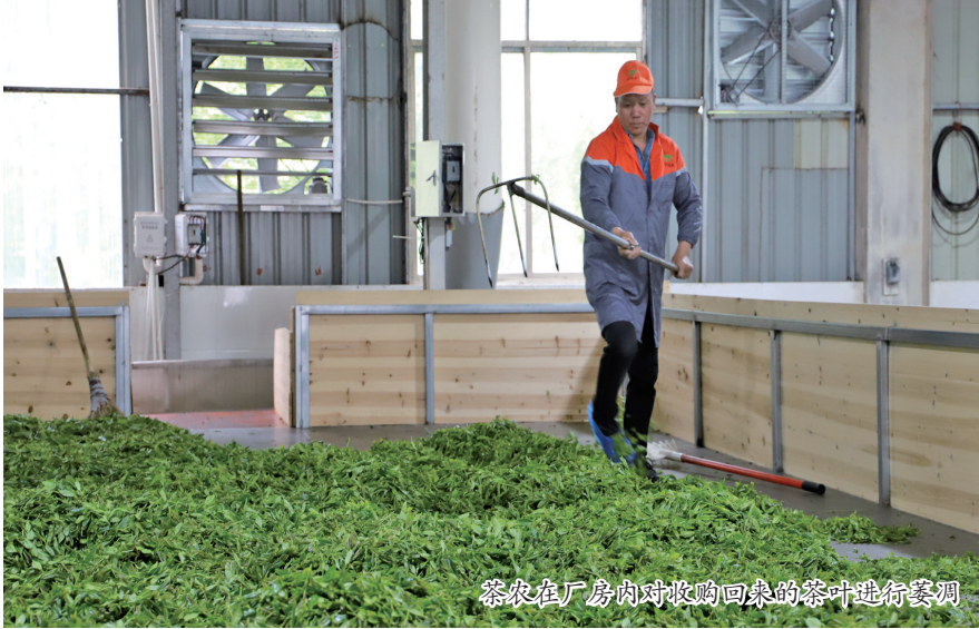
茶农在厂房内对收购回来的茶叶进行筛选

本报讯(朱乃章)5月26日,福鼎市点头镇综合执法队出动钩机对点头大坪、江美等村四处茶园违规施用草甘膦等化学除草剂的茶树进行挖除,坚决遏制茶园违规使用除草剂和化学农药现象。