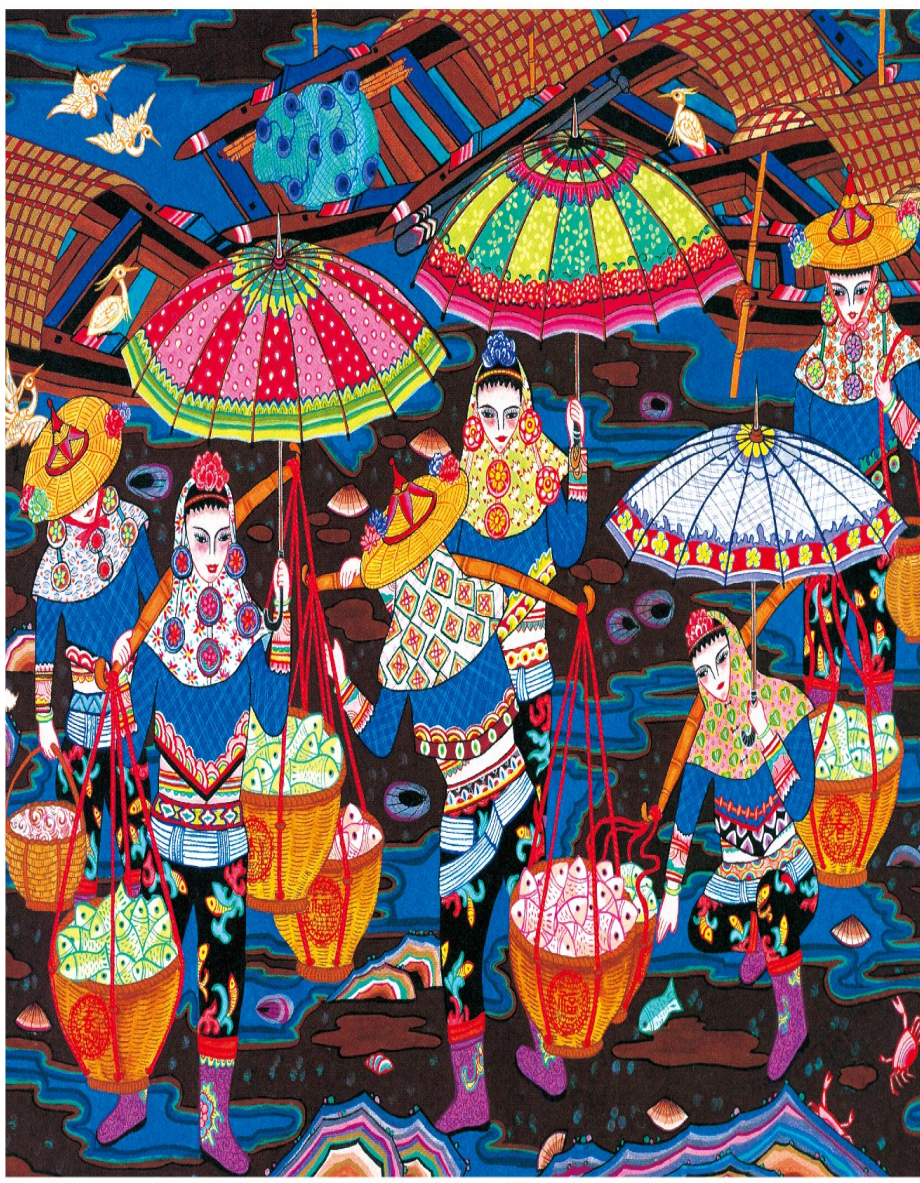
中国网络电视台制 福建龙海 连文祥作