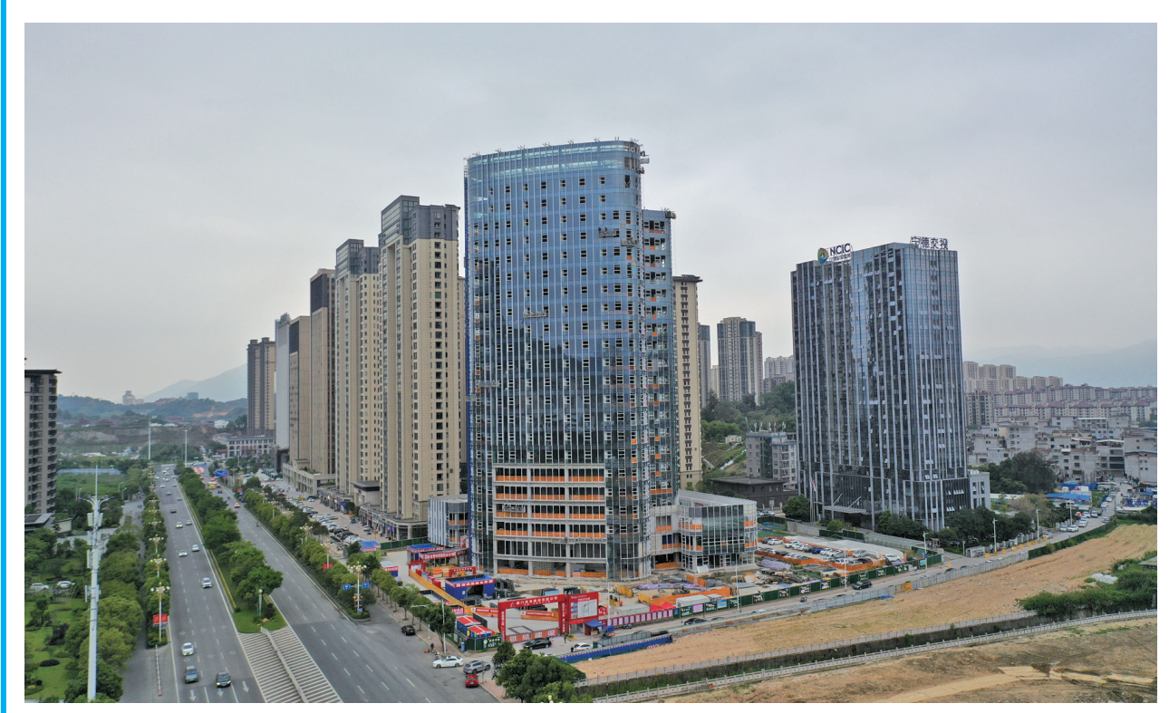
5月24日,记者在交投天行大厦项目现场看到,目前,项目在外立面幕墙收尾及室内公区、地下室二装工程施工阶段,主体工程将于今年8月竣工。 该项目位于东侨经济开发区,主要建设一栋商务办公楼及附属裙楼,最大建筑高度99.95米,层数最高为地上22层、地下1层,外墙为玻璃幕墙、铝板幕墙及局部外墙涂料。 项目自2021年7月开工以来,荣获“宁德市无欠薪标杆项目”及“市级施工安全标准化现场及智慧工地示范观摩工地”。

本报讯(记者 陈容 通讯员 魏中秋)“针对感病品种,建议喷药防治……”5月17日,周宁县高级农艺师李秀凤手机上的“马铃薯晚疫病监测”小程序发出预警,她立即前往马铃薯种植基地进行检测。 周宁县内峰峦叠嶂、溪涧密布,云雾环绕,形成了独特山区立体小气候,不仅风景秀美,也为县域内3万亩马铃薯生产提供得天独厚的条件,但受温度、湿度等影响,每年4月至5月,也是周宁春种马铃薯晚疫病高发期。 “马铃薯晚疫病是一种危害马铃薯叶、茎和薯块病害,从发病到流行非常快。过去,我们每周要深入田间地头进行观察,有时发现病症时,已经开始大面积传播。”李秀凤说。 要做到科学防治,智能化预警至关重要。今年,周宁县引进2台马铃薯晚疫病监测仪,分别安装在海拔不同的两个基地内,依托信息化平台,对田间马铃薯进行全天候监测。 据了解,该监测仪能实时监测种植区温度、湿度等数据,并远程传输到后台。当环境达到晚疫病流行条件时,系统会通过小程序发出预警,推送科学防控建议,相关人员可以快速有效地实施防治措施。 “我们会根据预警系统监测结果,提前喷药防治。同时,依托系统预警,减少用药盲目性,有效提升防治效果,确保丰收。”李秀凤说。