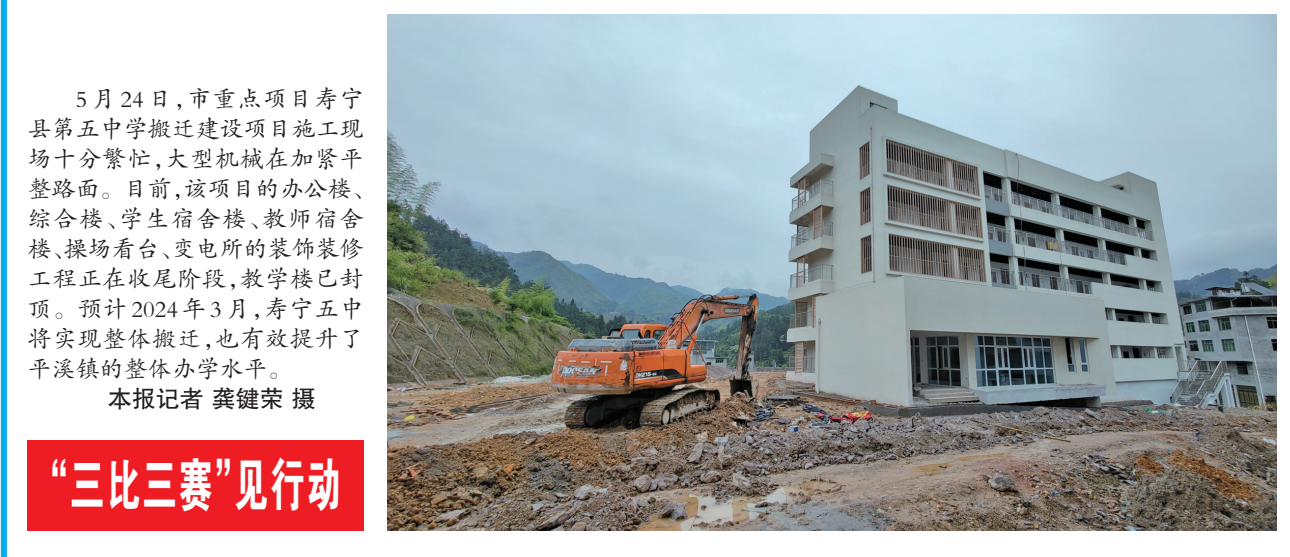
5月24日,市重点项目寿宁县第五中学搬迁建设项目施工现场十分繁忙,大型机械在加紧平整路面。目前,该项目的办公楼、综合楼、学生宿舍楼、教师宿舍楼、操场看台、变电所的装饰装修工程正在收尾阶段,教学楼已封顶。预计2024年3月,寿宁五中将实现整体搬迁,也有效提升了平溪镇的整体办学水平。