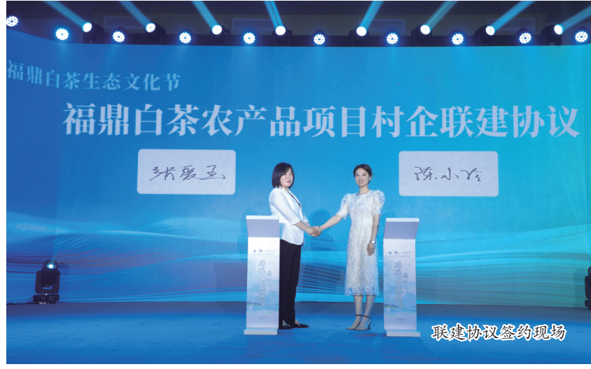
福鼎白茶农产品项目村企联建协议签约仪式现场

本报讯(记者 张文奎 文/图) 5月21日,由万里茶道(国际)协作体、福建省中华文化促进会、福建省茶叶学会指导,中华文化促进会万里茶道协作体、福鼎市福鼎白茶生态文化节组委会主办的2023年国际茶日万里茶道系列活动暨福溪镇首届福鼎白茶生态文化节在福溪镇湖林村举行。据了解,第四届“国际茶日”以“茶和世界·共品共享”为主题,湖林村以国际茶日为契机,借助万里茶道十年发展的势能,深入贯彻“三茶”统筹理念,通过多方合作共享,围绕生态建设大文章,深入挖掘和弘扬福鼎白茶文化、福鼎产区优势、湖林产业特色,推动福鼎“中国生态白茶之乡”品牌建设。