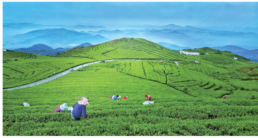
依托茶产业党建联盟实现村集体经济增收