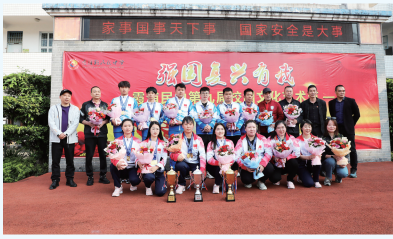
近日,在福建省第十届少数民族传统体育运动会上,霞浦县民族中学射弩、陀螺队奋勇拼搏,创下佳绩。射弩队包揽所设五个奖项的金牌,并获三银两铜。陀螺队获得女团、女双、男双、女单四个冠军和男团、男单、女单亚军及女单季军。