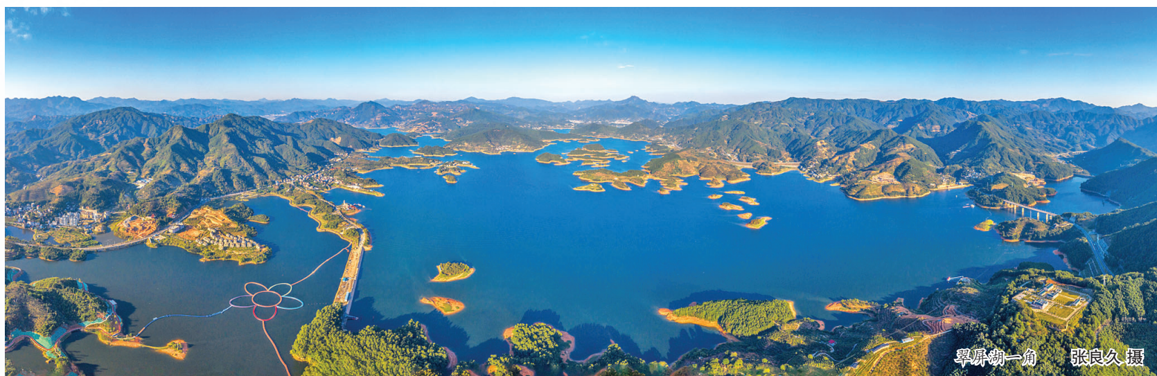
翠屏湖一角

业体系,以“原汁原味”的乡村度假新体验,营造主客共享、宜居宜游的城乡休闲新空间。