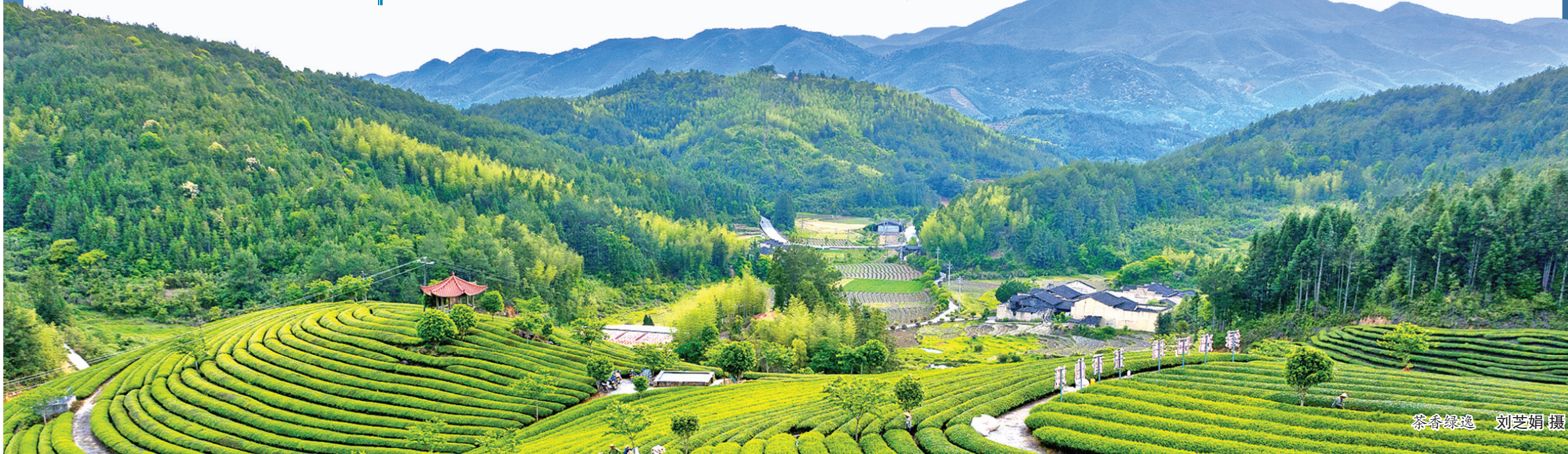
茶香绿逸