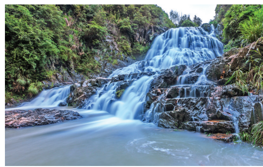
▲碗厂瀑布

不仅如此,借助文旅融合发展的东风,进一步催发了古田乡村旅游不断升腾的“烟火气”。通过深入挖掘地方文化特色,古田依托农耕文化、民俗文化、非遗文化、红色文化等,探索景村融合、旅居休闲、户外营地、乡村文旅综合体等微度假模式,推动一二三产、农文旅体融合发展,建设以生态康养为核心,研学露营、果蔬采摘、体育健身、亲子运动等业态共同发展的乡村旅游产