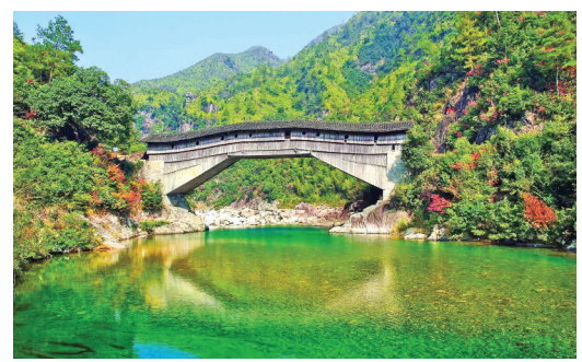
▲寿宁古廊桥