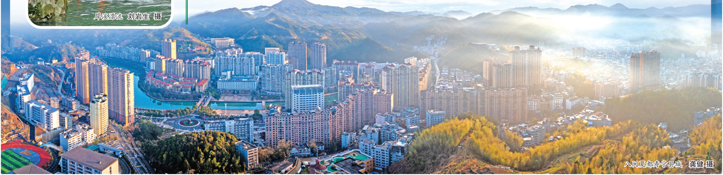
八闽夏都寿宁县城