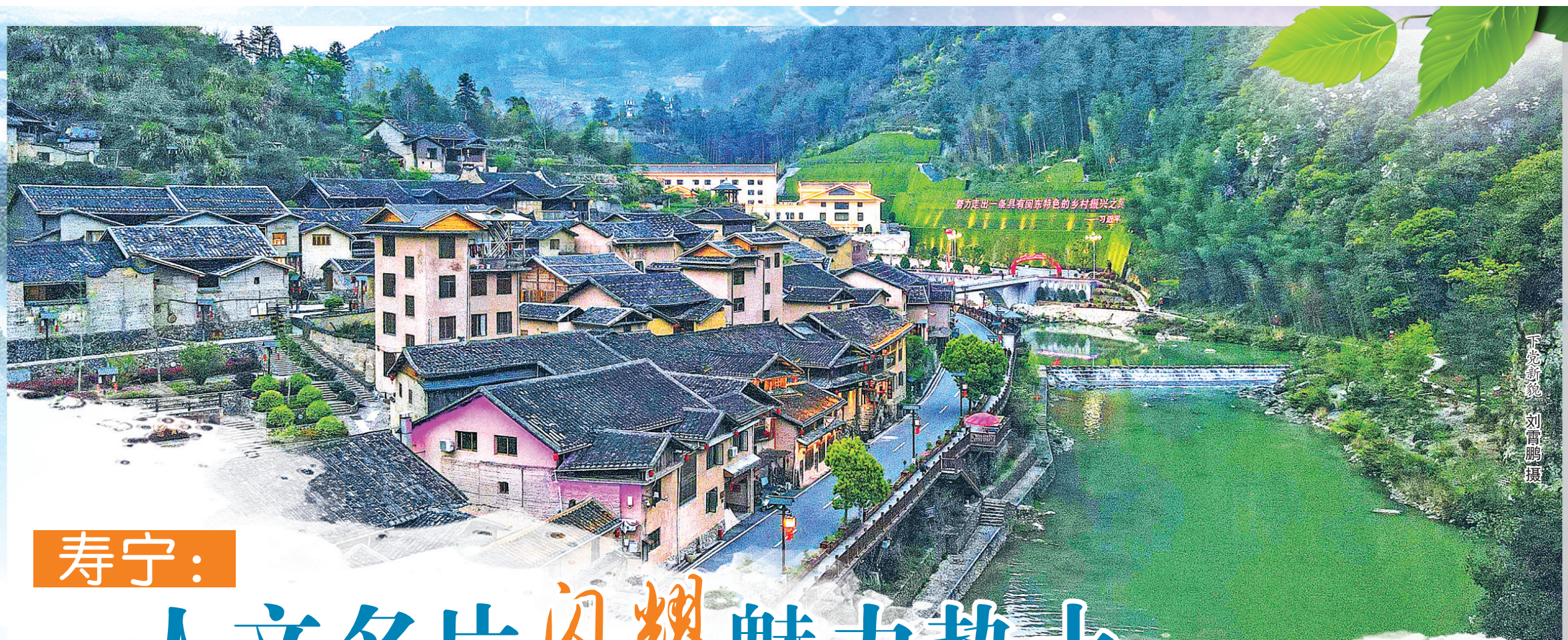
下党新貌