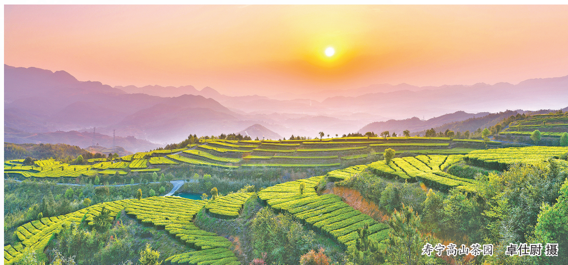
寿宁高山茶园