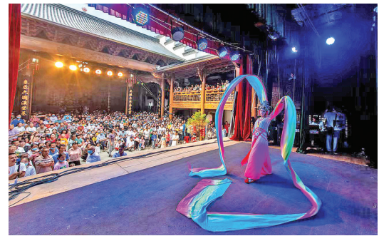
▲凤阳北路戏大舞台

近年来,下党立足发展成效,融合红色元素,突出乡土特色,以建设“中国红色新地标”为目标,致力打造全国党员教育培训示范基地和省级党性教育基地,着力加强下党村明清古民居和古廊桥鸾峰桥等保护性修复开发和红色旅游景观景点项目建设,推动红色旅游与干部教育培训融合发展。将红色文化、下党元素植入原有资源,规划建设“下党的味道”一条街商铺,建成乌金陶非遗传习所、提线木偶传习所、小邮局、小酒馆、初心茶楼、油画创作基