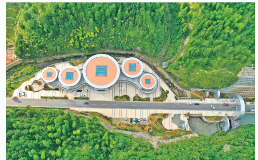
▲大安古银硎

地、幸福茶馆、“有事找道杰”驿站、75号青年直播带货基地等文创项目,新增八大干、山中珍菌、乌迷小丛林、廊桥技艺、兰庭时光等一批文旅新业态。