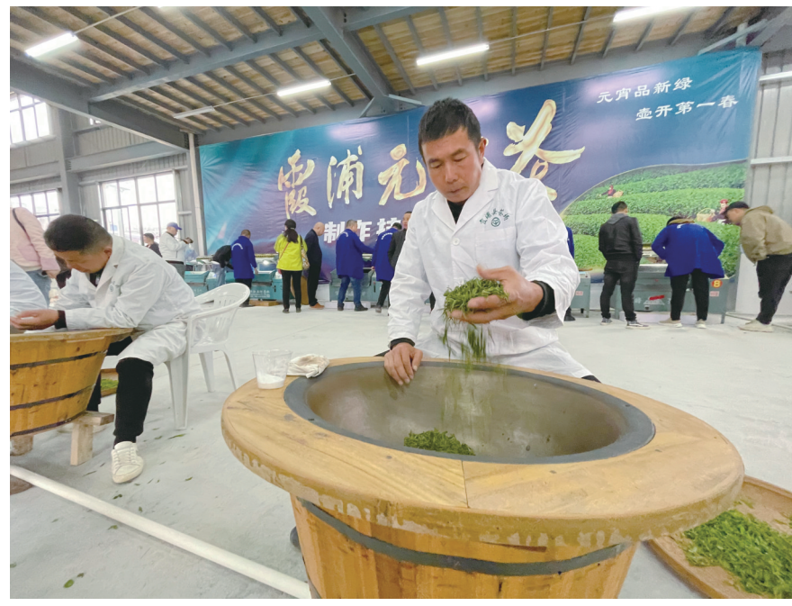
开茶节制茶技艺展示

本报讯(记者 张文奎 黄璐 文/图) 3月18日,霞浦县第二届开茶节暨“海纳百川·山育福茶”主题宣传活动在石门畲族乡茶岗村举办。本次开茶节由霞浦县委、县政府主办,石门畲族乡、县农业农村局承办。开茶节内容丰富多样,尽显茶乡魅力,同时也具有浓厚的民族风情,本次活动包括开茶节开幕式、制茶技艺展示及斗茶赛、茶乡集市、茶叶质量安全倡议活动、悦享茶旅风光、“老茶树保护区”揭牌仪式等系列主题活动,既弘扬了当地畲族传统文化,又营造出和谐美好的开茶丰收氛围。活动结束后,还进行了霞浦白茶斗茶赛颁奖仪式。