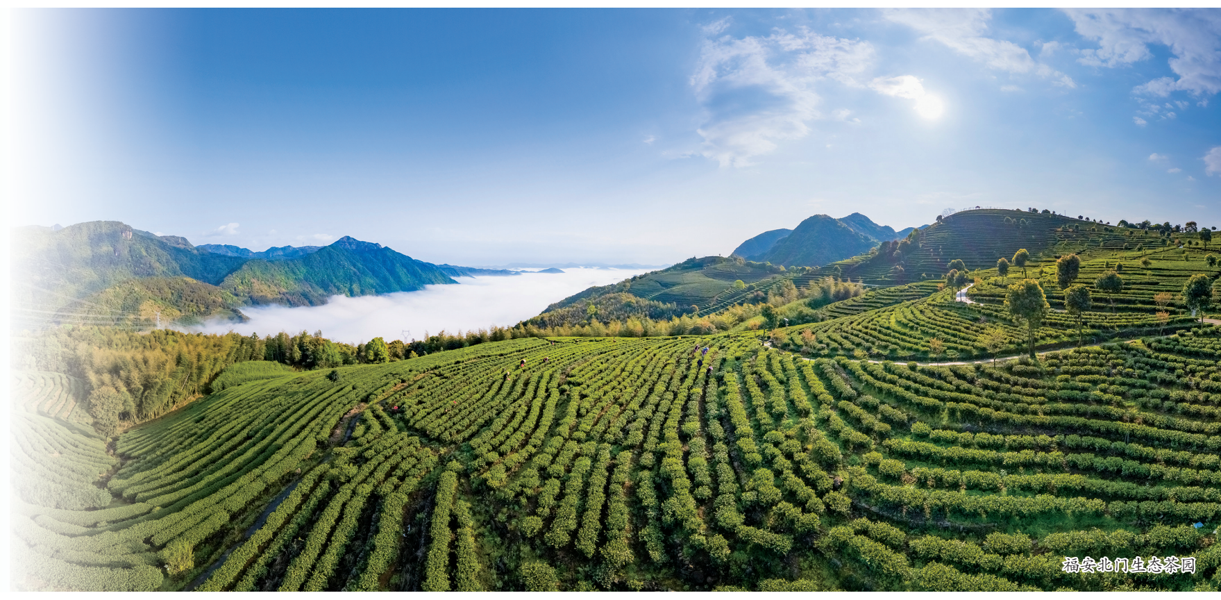
福安北门生态茶园

新时代、新征程,福安以茶为媒、向茶而兴,精心谋划茶产业,扎实推进品牌建设、科技兴茶、结构调整等一系列战略性举措,建立全国首个“三茶”研究院,揭牌“三茶融合创新园”,踏上了“茶产业、茶文化、茶科技”融合发展新征程。