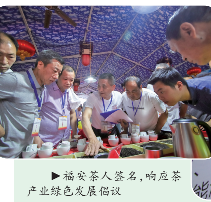
福安每年都要举办斗茶赛