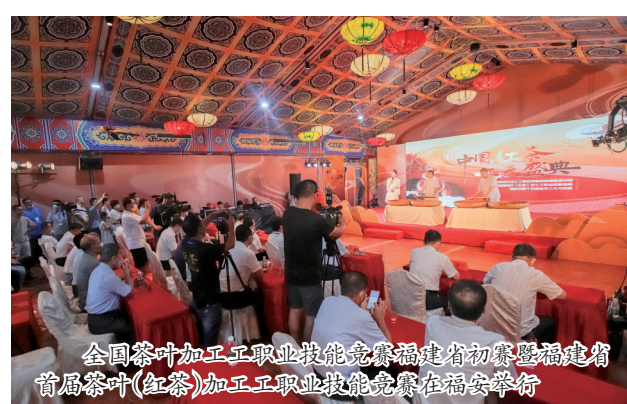
全国茶叶加工职业技能竞赛福建省初赛暨福建省首届茶叶(红茶)加工职业技能竞赛在福安举行