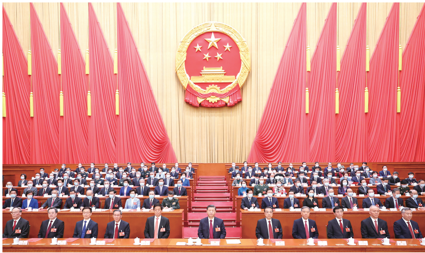
3月13日,第十四届全国人民代表大会第一次会议在北京人民大会堂闭幕。中共中央总书记、国家主席、中央军委主席习近平发表重要讲话。