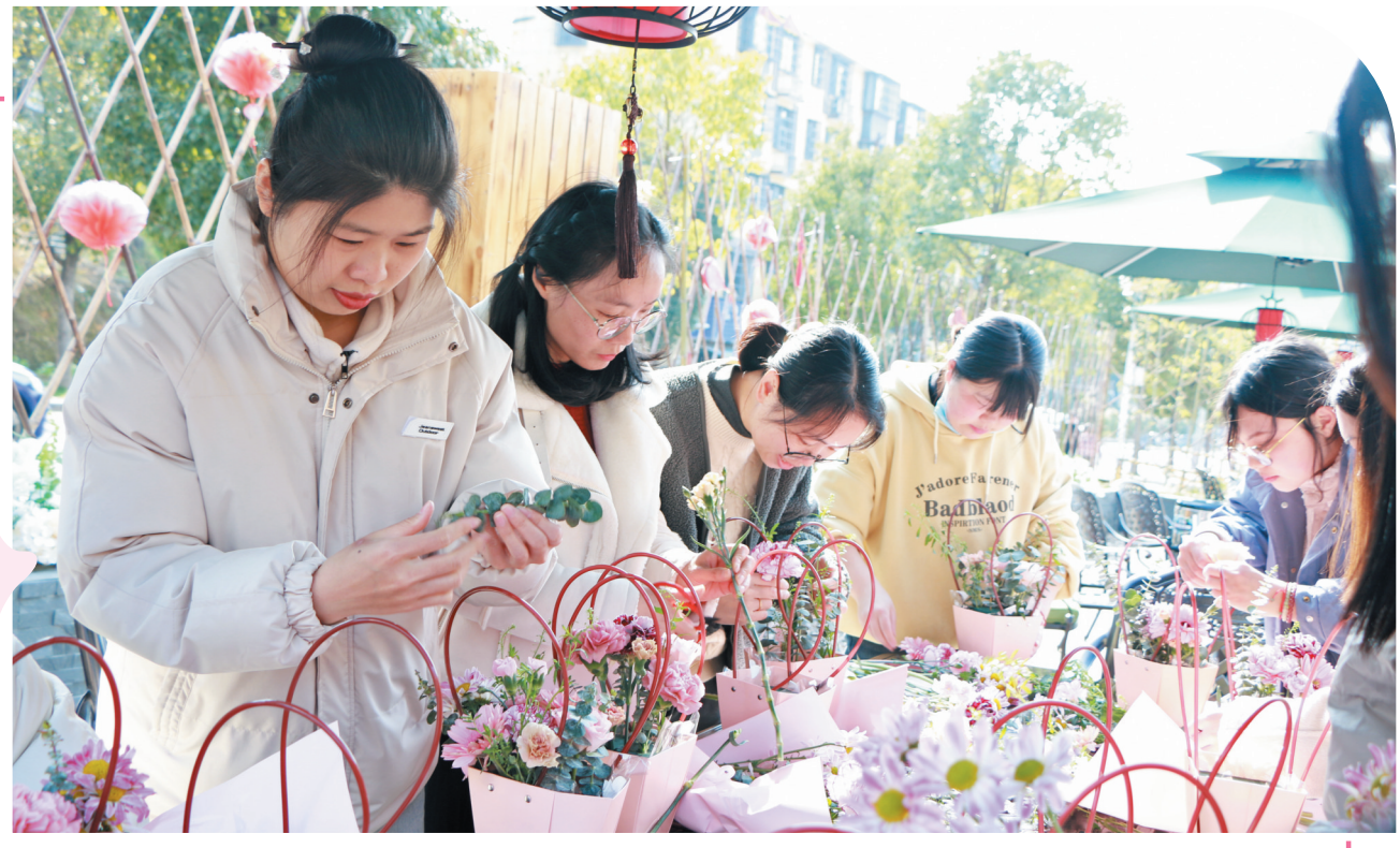
3月5日,福鼎市妇联联合桐山街道办事处开展纪念“三八”国际妇女节113周年暨“赓续雷锋精神 巾帼与爱同行”志愿服务活动,为20名环卫女工化妆、拍照,见证她们的美丽“蜕变”。