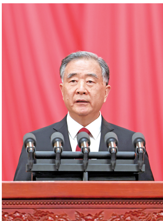
汪洋代表政协十三届全国委员会常务委员会向大会报告工作。