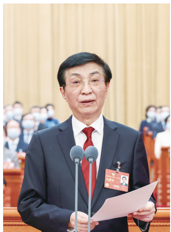
王沪宁主持开幕会。

新华社北京3月4日电 踔厉奋发共襄复兴伟业,勇毅前行再谱时代华章。历经光辉岁月、坚持团结和民主两大主题的人民政协,又迎来一个重要的历史时刻:中国人民政治协商会议第十四届全国委员会第一次会议4日下午在人民大会堂开幕。 三月北京,春意盎然。人民大会堂万人大礼堂内灯光璀璨,气氛庄重热烈。中国人民政治协商会议徽悬挂在主席台正中,十面鲜艳的红旗分列两侧。 全国政协十四届一次会议应出席委员2169人,实到2132人,符合规定人数。 全国政协十四届一次会议主席团常务主席王沪宁、石泰峰、胡春华、沈跃跃、王勇、周强、帕巴拉·格列朗杰、何厚铨、梁振英、巴特尔、苏辉、邵鸿、高云龙在主席台前排就座。 党和国家领导人习近平、李克强、栗战书、汪洋、李强、赵乐际、韩正、蔡奇、丁薛祥、李希、