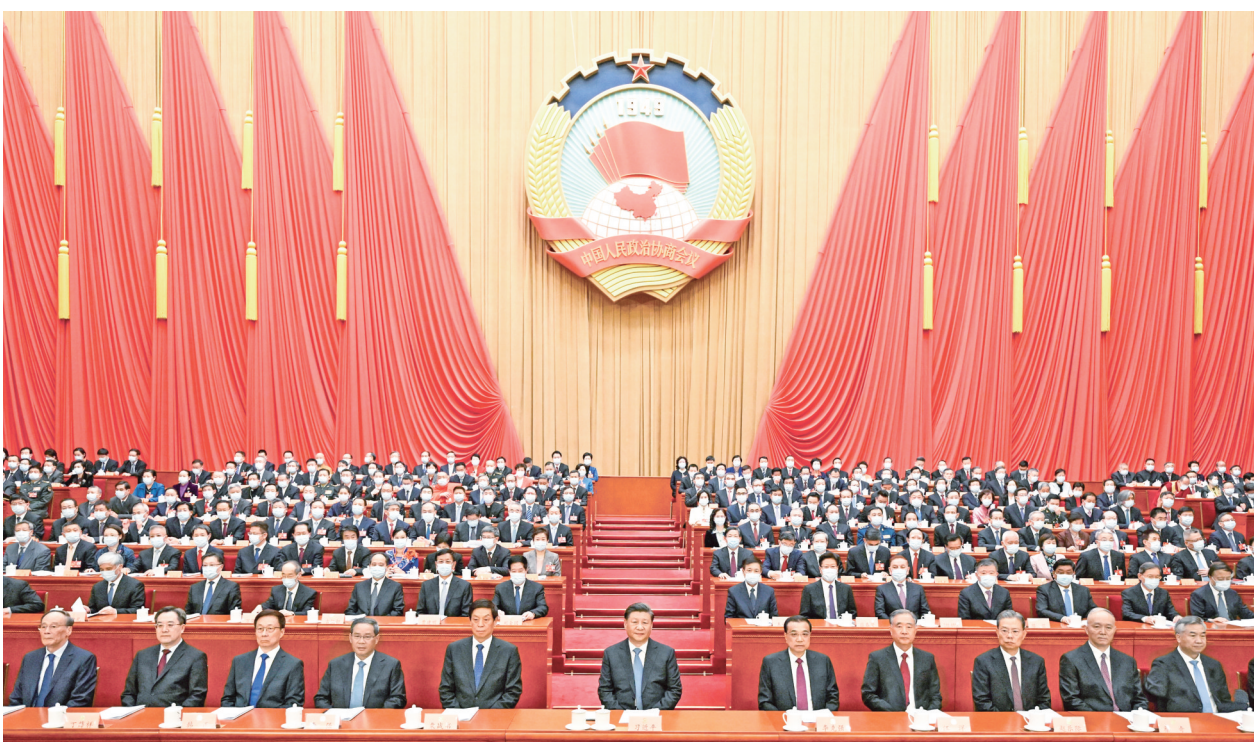
3月4日,中国人民政治协商会议第十四届全国委员会第一次会议在北京人民大会堂开幕。这是习近平、李克强、栗战书、汪洋、李强、赵乐际、韩正、蔡奇、丁薛祥、李希、王岐山在主席台就座。新华社记者 李学仁 摄

习近平李克强栗战书李强赵乐际韩正蔡奇丁薛祥李希王岐山到会祝贺 汪洋作政协十三届常委会工作报告 王沪宁主持会议 邵鸿作提案工作情况报告