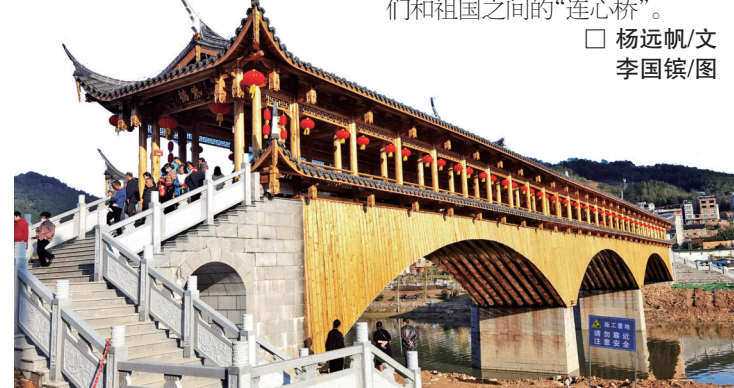
□ 杨远帆/文

在古田历史上,也曾出现过一座长度达200米的木拱廊桥——紫桥,惜于1933年焚毁于战乱;1959年,原址淹没于古田溪水库底下。乾隆版《古田县志》对当时的紫桥风貌有详细的记载:“紫桥为翠