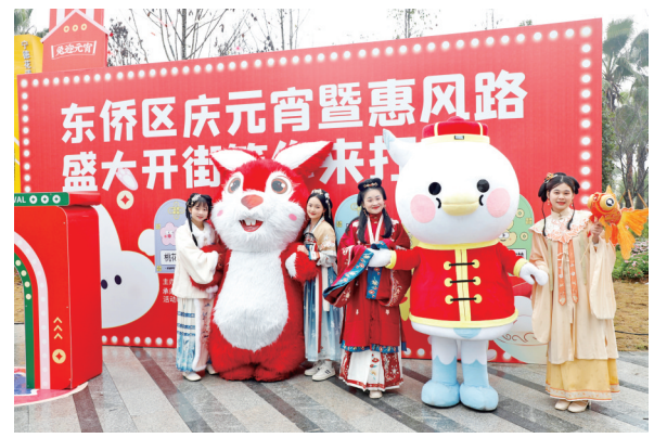
花漾街区开街仪式

火爆朋友圈的花漾街区,你去过了吗? 元宵节期间,东侨经济技术开发区党工委宣传部、东侨社会事务局、东侨商务局联合举办了“东侨开发区元宵暨惠风路”开街仪式,结合花卉展,开展了汉唐古典舞蹈、歌曲演唱、萨克斯演奏、古筝演奏、国风汉服秀、气球小丑表演、猜灯谜等系列活动,吸引了众多市民朋友踊跃参与体验,也为元宵节增添了一份别样的浪漫色彩。