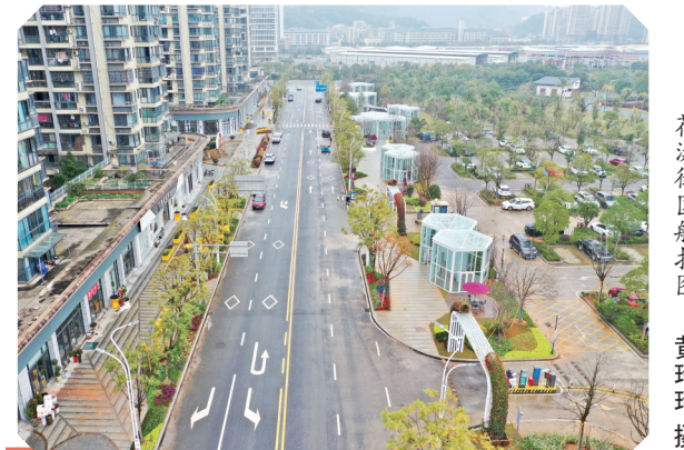
花漾街区航拍图