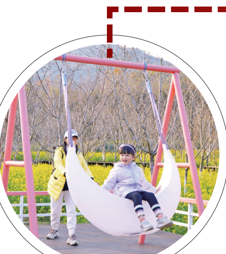
玉潭樱花谷花正妍人欢笑

近期,随着气温的不断升高,我市各地梅花、樱花、桃花、油菜花、郁金香、玉兰等各色鲜花竞相开放,不少网友的朋友圈里也被花儿刷起了屏,屏上屏下春暖花开了。