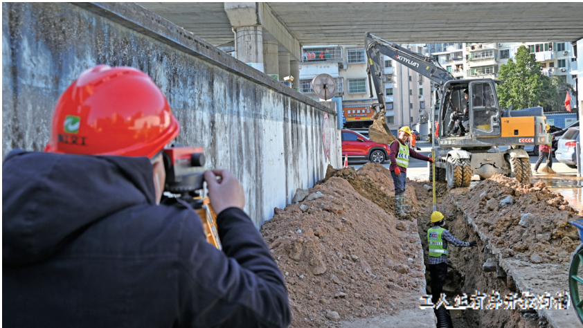
工人在蕉城污水处理厂

本报讯(记者 陈容 通讯员 余汕康文/图) 2月16日,记者在宁德市蕉城、东侨片区污水提质增效工程(管网部分)交警大队宿舍施工现场看到,工人正有序开挖沟槽,准备铺设污水管线。