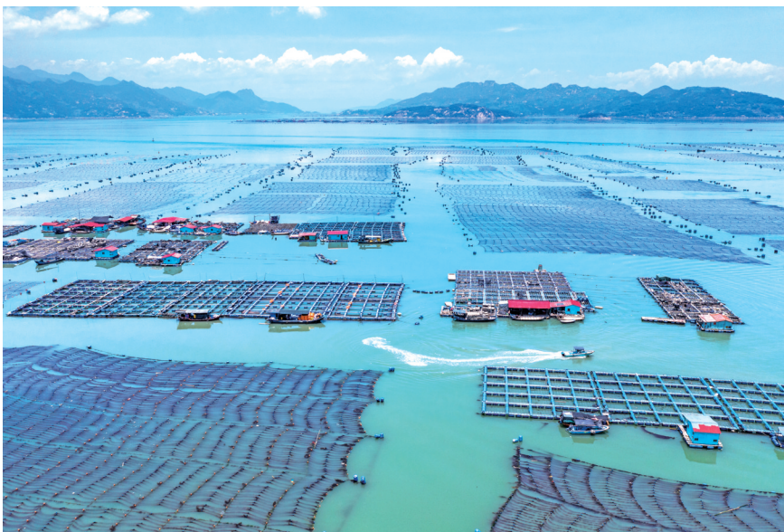
▲网箱藻类养殖