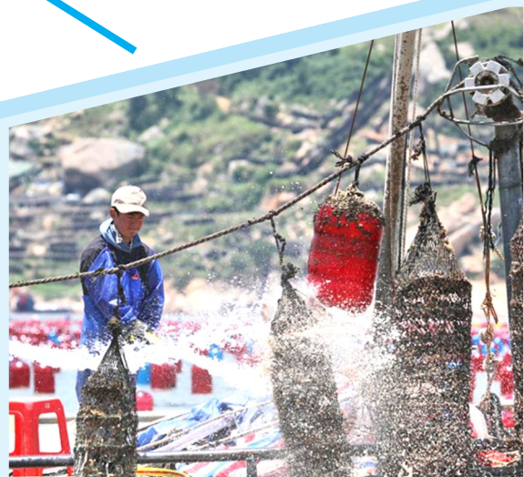
▲生蚝养殖

池澳村是北壁乡产业发展提质增效的生动缩影。近年来,北壁乡大力发展“8+1”特色产业,形成了鲍鱼、海带、龙须菜、大黄鱼、地瓜烧等区域特色优势产业,积极引进生蚝、海参、马面鲀等养殖新品种。目前,北壁乡藻类养殖面积近5万亩,网箱养殖近8万框,已形成产值达10亿元的鲍鱼养殖基地。同时,成立了北壁乡电子商务产业园,开展电商直播,努力拓宽群众致富增收渠道,北壁乡东冲村鲍鱼上榜市级“一村一品”示范村名单。