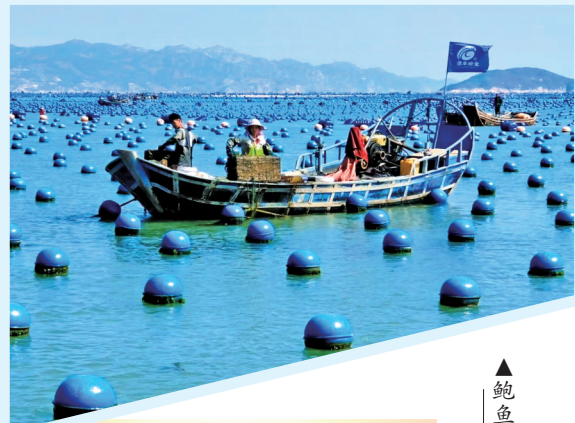
▲鲍鱼养殖海上作业