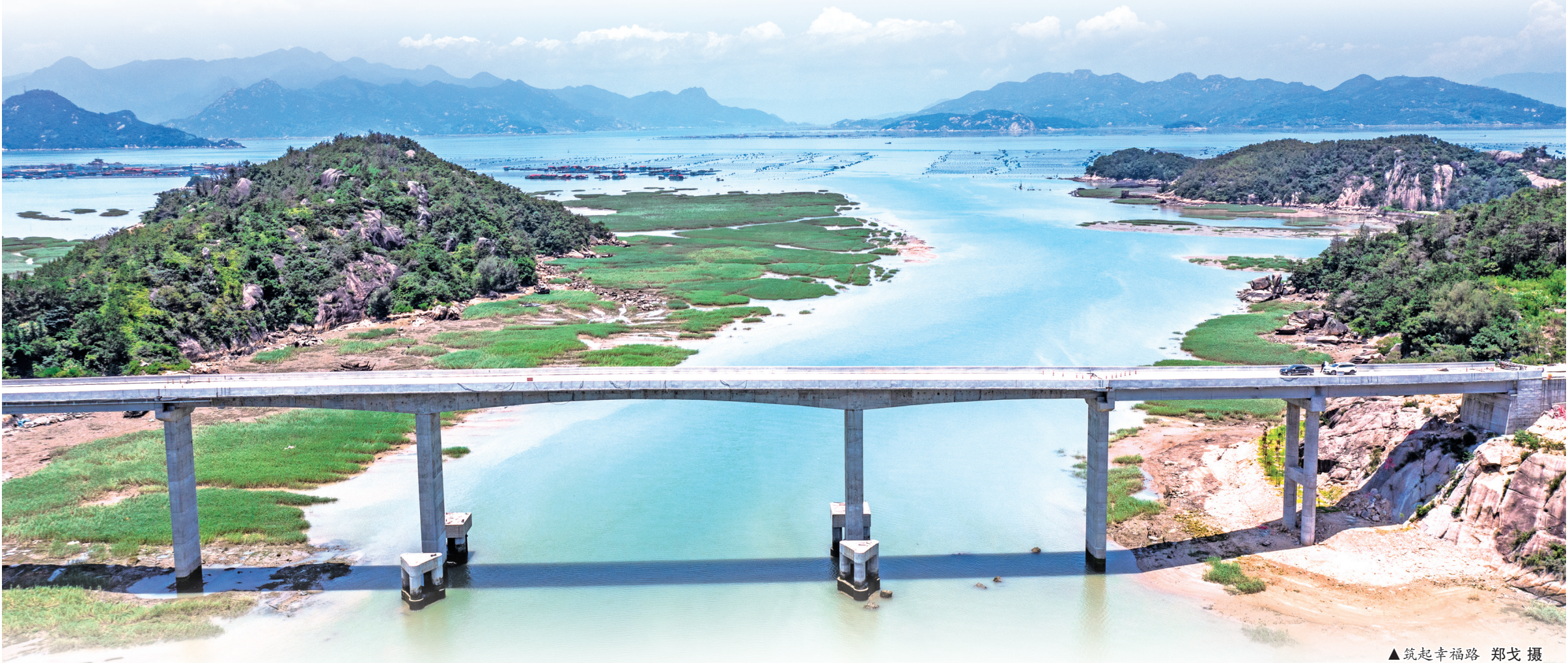
▲筑起幸福路