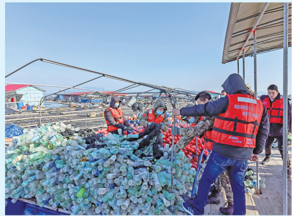
▲海上养殖综合整治统一行动