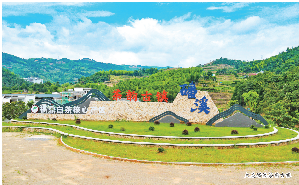
大美磻溪茶韵古镇

统筹推进茶产业与生态文化、农耕文化、商贸文化、康养文化、休闲文化、美学文化等结合,福鼎催生一批涉茶产业新业态,形成6条茶旅融合的精品路线。点头镇入选“全国乡村特色产业超十亿元镇超亿元村”;磻溪镇结合“大美磻溪·茶韵古镇”打造乡村振兴景观带;白琳镇规划修建白琳老街,初步形成白琳茶旅网红打卡地标;管阳镇创新打造“云中管阳”生态形象,展现茶文旅优势;太姥山镇成功举办第三