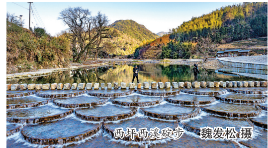
西坪西溪碇步

溪水淙淙,从碇步桥上缓步前行,脚步轻盈,犹如置身烟雨江南,遇上水雾氤氲,更是回味无穷……1月21日晚,《碇步桥》亮相央视春晚,将泰顺任水碇步桥的韵律与美感带到大众眼前,引来众多网友点赞。