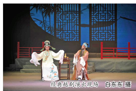
经典越剧演出现场

2月1日至3日每晚7时,福鼎市文体和旅游局联合福鼎市闽浙边界文化艺术交流中心在人民剧场举办《2023年元宵越剧专场演出》文化活动,超过2000余人次市民共同观看演出。