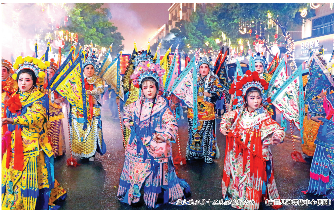
盛大的正月十五民俗踩街活动

春·品民俗”线上知识竞赛挑战赛也吸引了5000余名网友参加、浏览。据统计,春节假日期间,古田县在“福”文化的衬托下,文旅市场不断升温,全县共接待游客19.13万人次,实现收入9373.7万元,使当地的文旅市场迎来了新年“开门红”,许多市民止不住感叹:“久违的烟火气回来啦!”