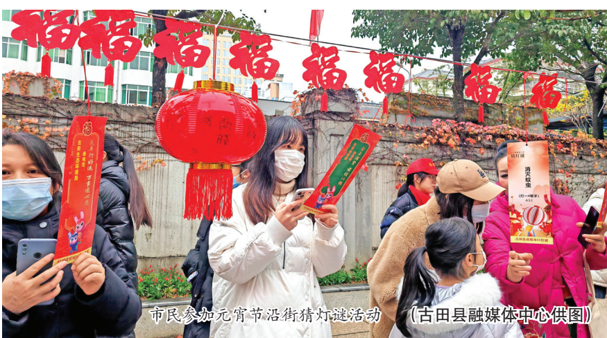
市民参加元宵节沿街猜灯谜活动