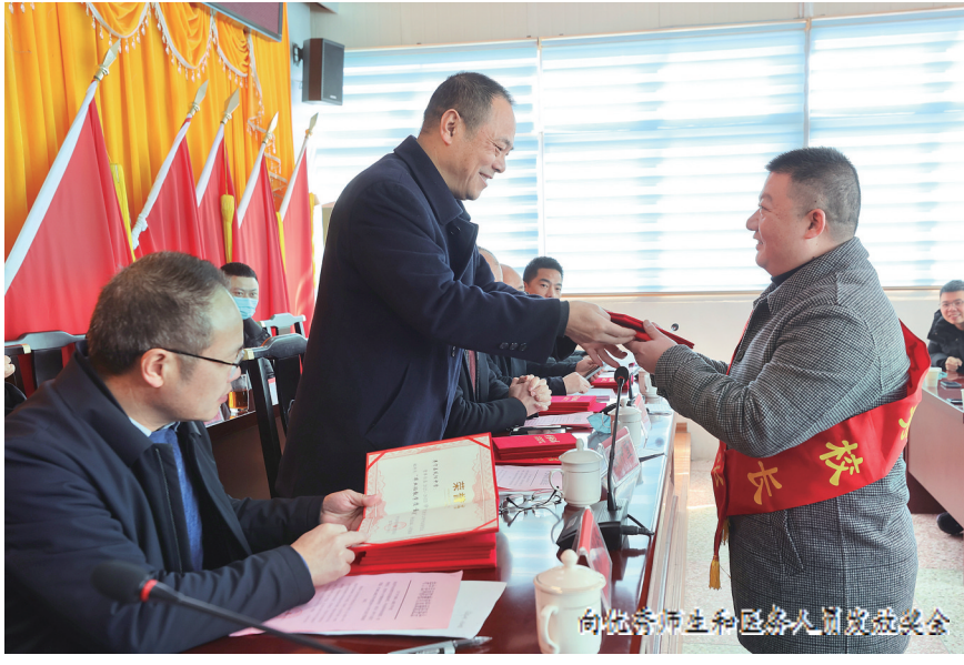
向优秀师生和医务人员颁发奖金