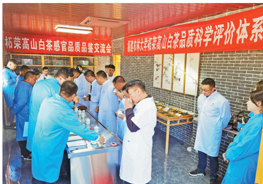
柘荣联合福建农林大学开展柘荣高山白茶品鉴会。

高山白茶有志气,政府推动有底气。一年以来,柘荣县加大了对高山白茶的对外宣传造势。北京马连道上,“柘荣高山白茶”跨街横幅大而醒目;华夏航