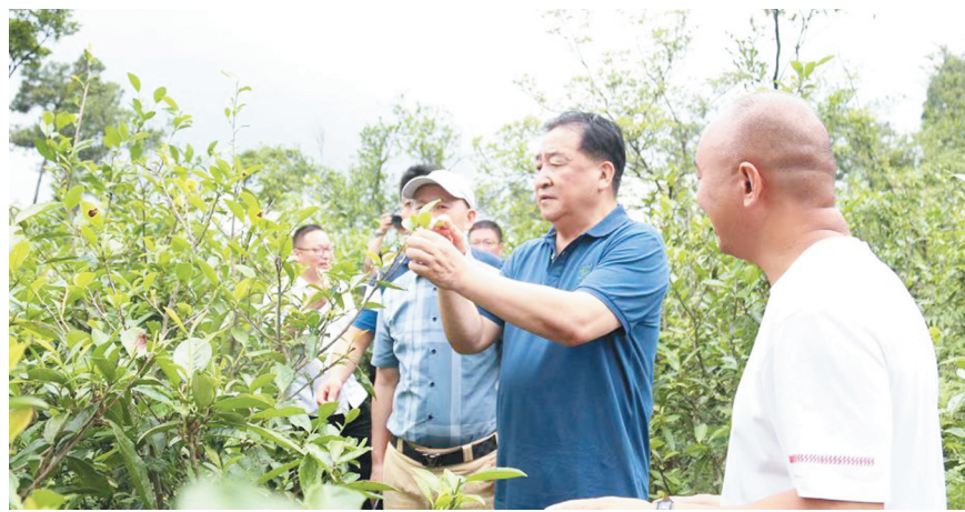
著名演员姜昆深入柘荣县生态茶园开展“文化助力”调研

空机舱内,“柘荣高山白茶”品牌元素吸引乘客眼球;在福州长乐机场、沈海高速公路、福鼎宁德霞浦福安等火车站要位置,“柘荣高山白茶”标语更是引人注目。茶业企业也发声而动,纷纷在北京王府井、济南、福州、厦门等大城市开设了“柘荣高山白茶”门面店。