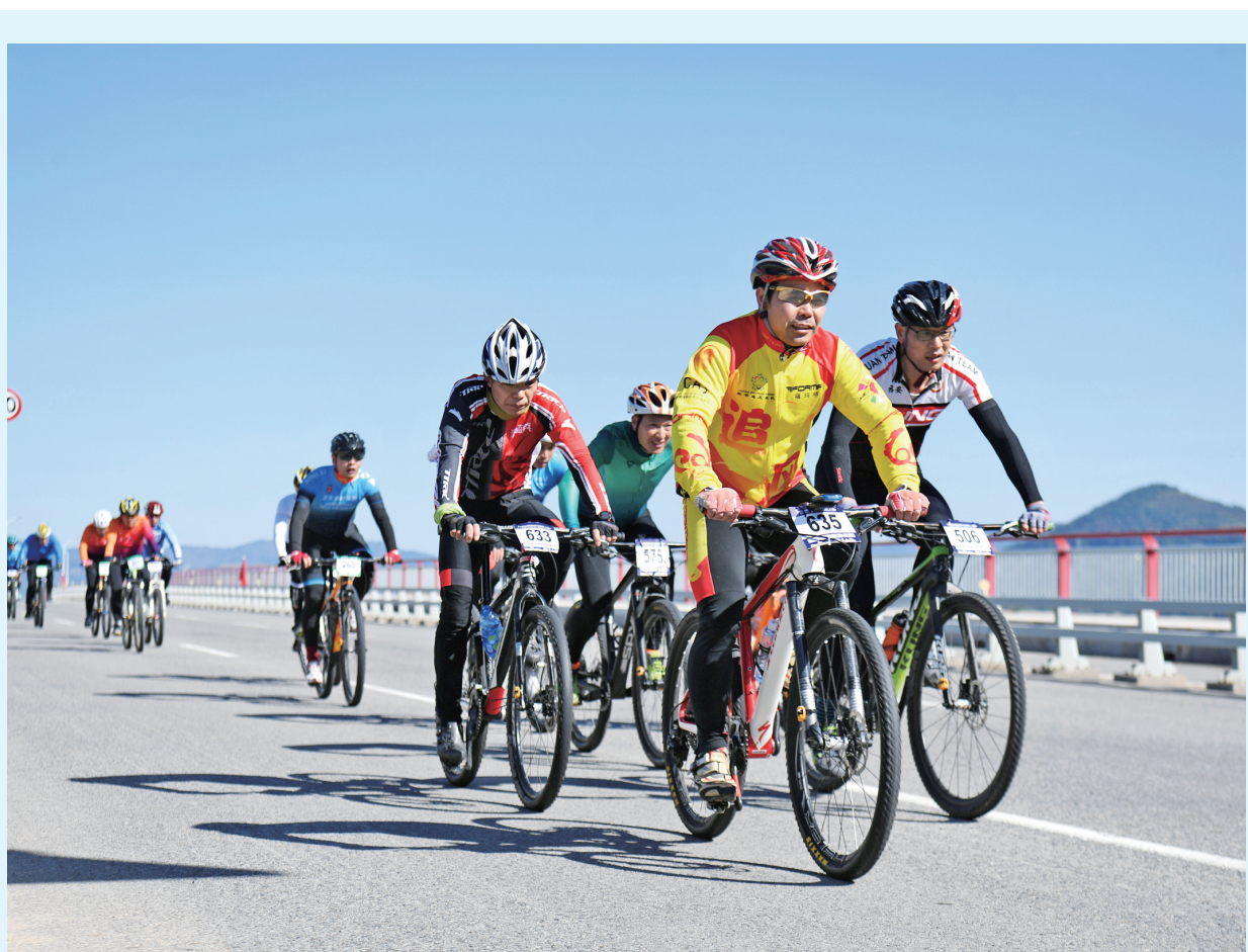
省自行车联赛(宁德站)暨福建省全民健身运动会(宁德赛区)自行车公开赛现场。

宁德市青少年宫少工委的成立是我市深化少先队改革、推动校外少先队专业化建设的生动实践,为我市各县(市)区青少年宫成立少工委起到了良好示范作用。作为我市校外少先队组织,宁德市青少年宫少工委将充分发挥校外教育实践功能和资源优势,传承红色基因,把握思想政治引领,为我市少先队事业的发展做出贡献,助力我市少先队工作再展新风采。